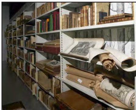
I denne reol er opstillet de bøger der blev fundet i bogtyvens hjem.

UNESCO i 1992 iværksatte sit store Memory of the World-program. Programmet skal bidrage til at beskytte og bevare de mange uerstattelige historiske dokumenter, incl. audio-visuelle materialer, i bibliotekers og arkivers samlinger verden over.