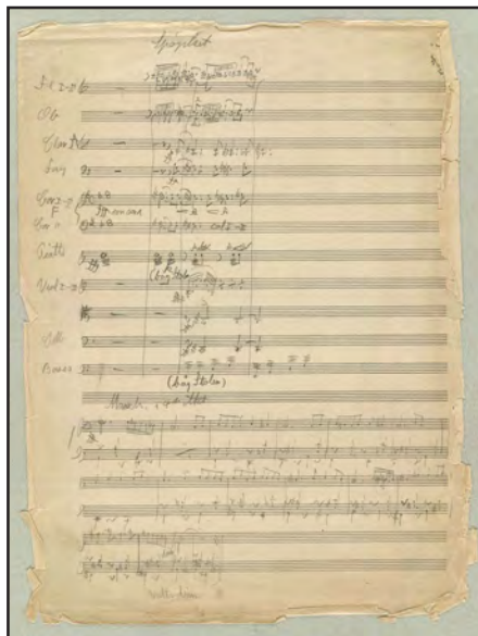
Side fra de nyerhvervede Aladdin -skitser. Øverst sats fra 5. akt (Carl Nielsen Udgaven bd. I/8), her med titlen Spøgelset . Nederst en ikke anvendt skitse til en march i 4. akt.

Materialet er allerede beskrevet i Carl Nielsen Udgavens bind I/8 som „kilde G“ - men dengang ifølge sagens natur kun på baggrund af kopier af disse skitser. Nu har