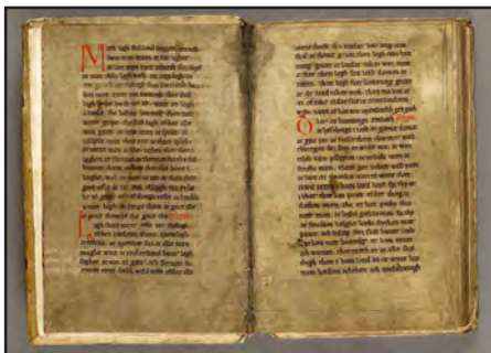
Det omtalte håndskrift, Codex Holmiensis (C37) med indledningsordene Med lov skal land bygges .

ikke taget konkrete skridt med hensyn til tilbagelevering af blandt andet det i spørgsmålet omtalte eksemplar af Jyske Lov.