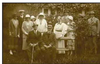
foto- grafiet, hvor Ancher- ne er kommet i fint