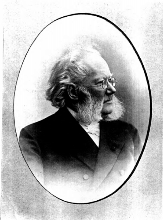
Henrik Ibsen .

DET ER NATURLIGVIS RIGTIGT, at Henrik Ibsens Død nu — efter Aars Sygdom og Affældighed, der sløredes hans klare Aand — ikke var den Begivenhed, den vilde have været, om han var gaaet bort, medens han endnu stod midt i sit Arbejde. Menneskene glemmer utaknemligt og hurtigt, og mange endog af dem, for hvem Henrik Ibsen i sin Tid var den store, altoverskyggende Oplevelse, havde vel længst lagt ham og hans Navn tilside og slaaet lidt af paa den Ærbødighed, hvormed de tidligere i deres Inderste hilste det; der var jo nok af de Særheder og Smaaskavanker, selv ikke den største bliver fri for, man i Stedet kunde hægte sig ved. Sikker har dog Dødsbudskabet slaaet dybt ned i mange. Selv om man saa afgjort som noget vidste, at Henrik Ibsen var en gammel og brudt Mand, hvis Røst ingensinde mere vilde høres, virkede dog den endelige og uigenkaldelige Bekræftelse derpaa med sin stærke, sølsomme Møgt og kaldte paany alle Minder frem.