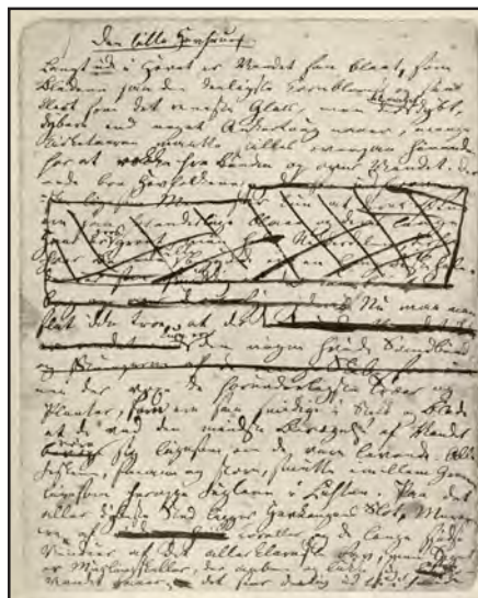
H.C. Andersens eventyr Den lille havfrue 1837 kom på kanonlisten.

Blandt de manuskripter, der nu er tilgængelige online, kan nævnes Søren