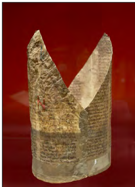
Bispehue klippet af islandsk håndskrift. Arnarnagæansk Institut.