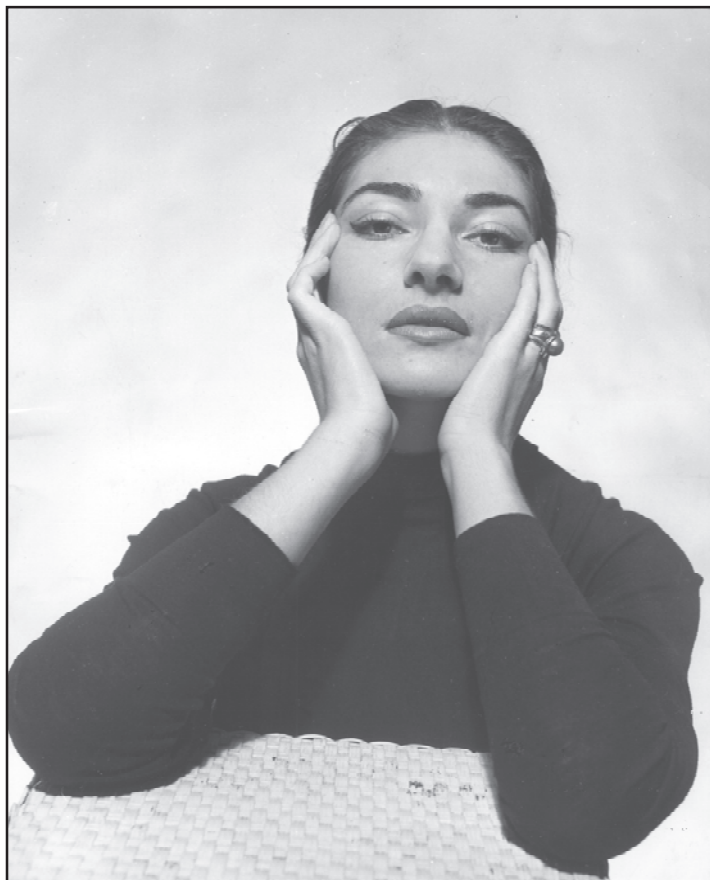
Maria Callas.

Krige og konflikter spiller naturligvis en stor rolle, og krigsfotografiet indtog da også en fremtrædende plads i udstillingen. Et fotografi, der har klar forbindelse til Anden Verdenskrig, er for eksempel billedet af feltmarskal Montgomery, der tilbydes på Københavns Rådhusplads efter befrielsen i maj 1945. Skønt billedet er taget flere dage efter selve befrielsen – Montgomery kom først til Danmark 12. maj – er det for mange danskere selve indbegrebet af befrielsesdagen 5. maj.