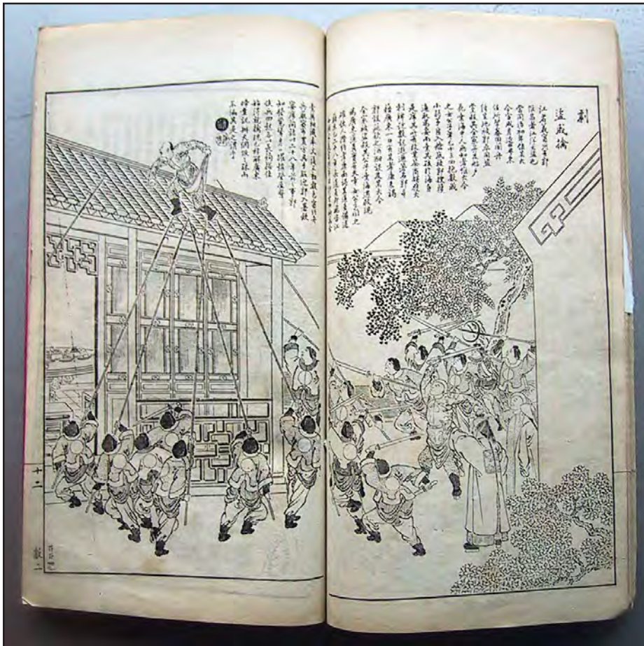
En regeringsmodstander prøver at flygte fra politiet i engang i den tidlige del af 1896. Fra det kinesiske magasin Dianshizhai huabao. Erhvervet til Orientalisk og Judaistisk Afdeling.

Biblioteket har erhvervet en række Vagn Holmboe-manuskripter, bl.a. til 9. symfoni, Concerto nr.4, Frise , Laudate Dominum og Sinfonia in Memoriam .