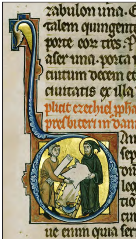
Illustration fra Hamburgbibelen, der viser et led i bogfremstillingen (Det Kongelige Bibliotek).

Som det ses, nominerer de enkelte lande værker, dokumenter og samlinger ud fra unikitets- og betydningskriterier uanset proveniens, idet mange dokumenters nuværende opholdssted er udtryk for en ofte lang og uransagelig vandringsproces. Det er