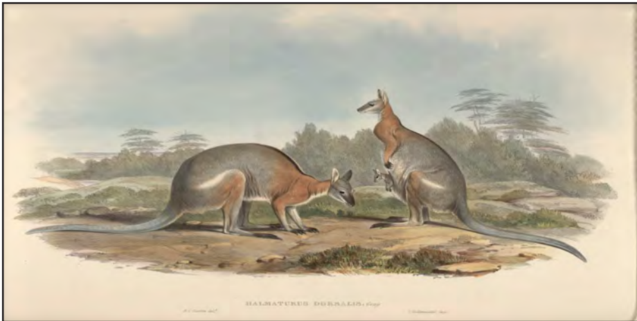
Den Classenske samling af naturhistoriske plancheværker. Nomineret til Memory of the World-listen 1997 John Gould: Mammals of Australia, bind 1-3, 1863 (Det Kongelige Bibliotek).

Parallelt hermed lancerede UNESCO i 1992 sit Memory of the World -program (MoW) for den skrevne og audiovisuelle kulturarv. Formålet er at skabe bevidsthed om, at det ligeledes er nødvendigt at beskytte og bevare de mange uerstattelige