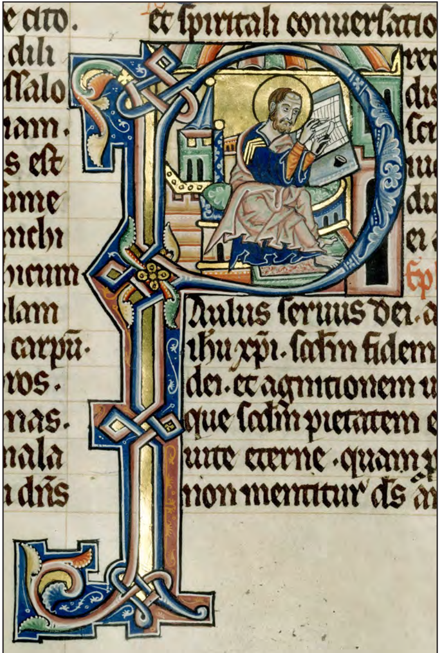
Illustration fra Hamburgbibelen, der viser et led i bogfremstillingen (Det Kongelige Bibliotek).