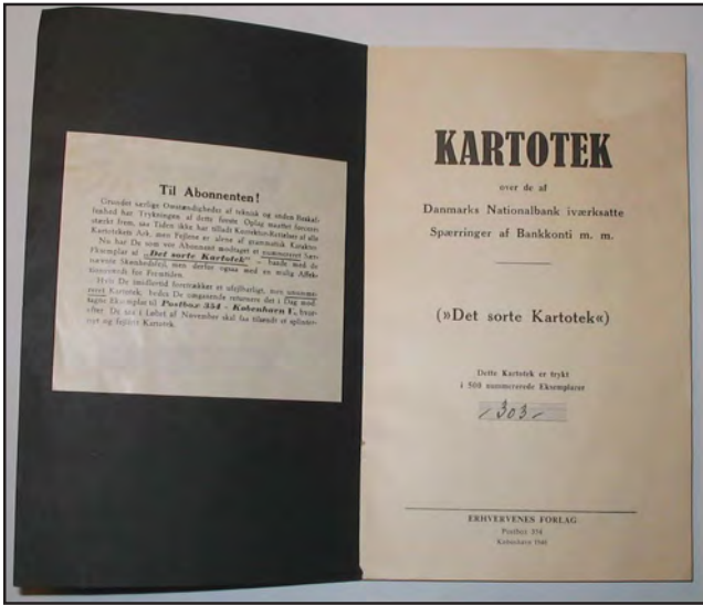
Det sorte kartotek eller Nationalbankens spærringer af bankkonti fra personer, der tilsyneladende havde involveret sig i økonomiske transaktioner med besættelsesmagten og hvis navne blev offentliggjort på lignende måde som i Bovrup-Kartoteket. Kartoteket blev dog kun distribueret i begrænset omfang og formentlig kontrolleret af justitsministeriet i modsætning til Bovrup-Kartoteket. (Eget foto).

magten. Kartoteket er af samme størrelse som 'Bovrup-Kartoteket', men med sort omslag, deraf navnet, selvom eksempler på beigefarvede omslag ligeledes er kendt. Dernæst er trykning, typografi samt papirkvalitet af en helt anden bedre type end 'Bovrup-Kartoteket'. I indledningen til 'Det Sorte Kartotek' hedder det, at 'Grundet særlige Omstændigheder af teknisk og anden Beskaffenhed har Trykningen af dette første Oplag maattet forceres stærkt frem, saa Tiden ikke har tilladt Korrektur-Rettelser af alle Kartotekets Ark, men Fejlene er alene af grammatisk Karakter.' Forfatteren er i skrivende stund ikke bekendt med, hvor mange oplag der udsendes af dette kartotek, men 500 stykker angives at være nummererede, men unummerede kartoteker blev ligeledes udgivet. Det er i det foreliggende ikke hensigten, at beskæftige sig nærmere med dette andet kartotek. Blot skal det nævnes, at det i lighed med 'Bovrup-Kartoteket' af type V antyder en tilsvarende officiel afsender, muligvis også udgivet på foranledning af eller måske i samarbejde med de daværende