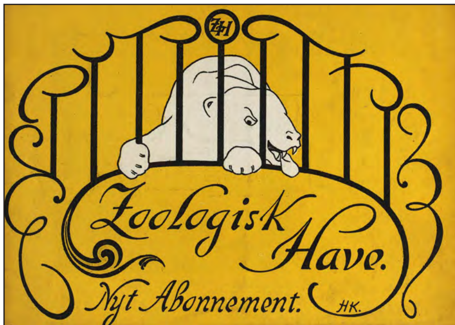
Zoologisk Have : Nyt Abonnement. 1901.