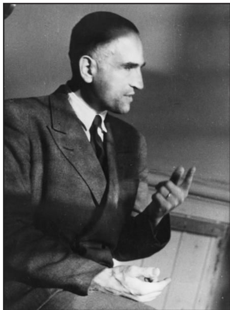
Werner Best fotograferet uden SS-uniform efter maj 1945, da han skulle forklare og forsvare den af ham førte politik i Danmark november 1942-maj 1945. En dødsstraf ved Københavns Byret blev ændret til fængsel, og Best kunne forlade Danmark som en fri mand 29. august 1951.