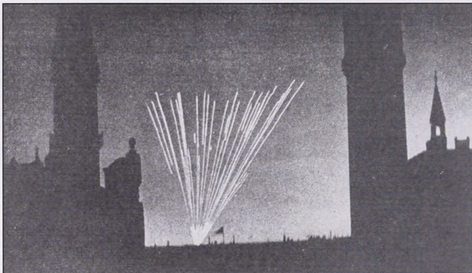
Billede fra Rådhuspladsen i København fra en af de første natlige luftalarmer. Det tyske antiluftsskyts sporprojektiler virkede som et festfyrværkeri, men de talrige granatsplinter forårsagede talrige skader og ulykker (C. Næsh Henriksen: Den danske Kamp, 1948, s. 112).