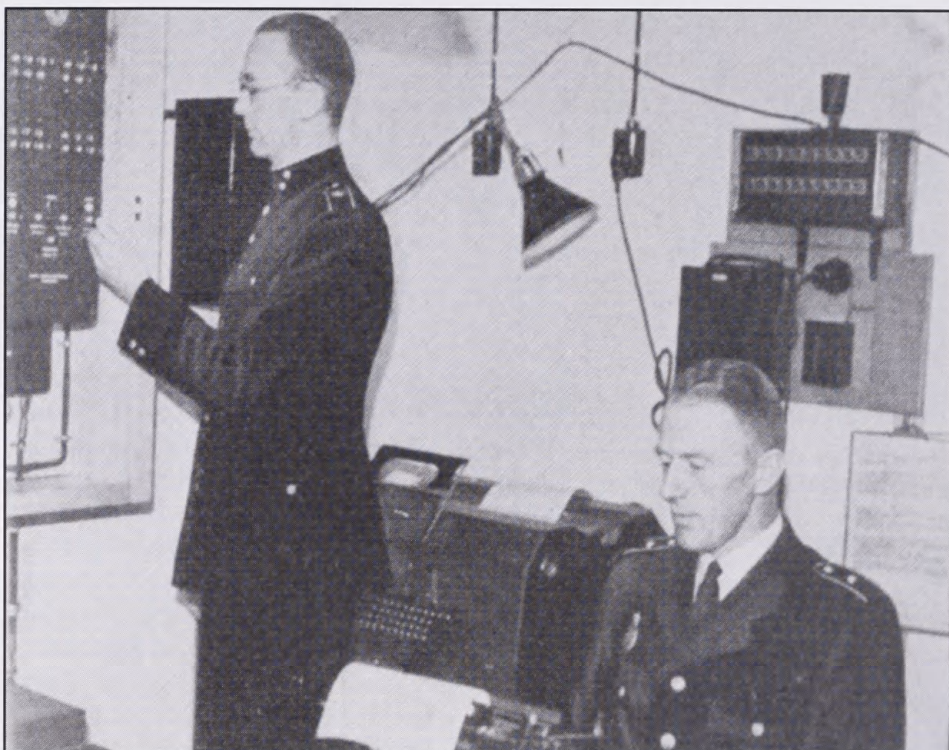
Billede fra Statens civile Luftværns kommandocentral i København. Den vagthavende overbetjent står med fingeren på den knap, der fik sirenerne i Storkøbenhavn til at lyde. Et enkelt tryk var nok til at få en lille million mennesker ud af sengene og i beskyttelsesrum (Hvem Hvad Hvor 1941, s. 285).