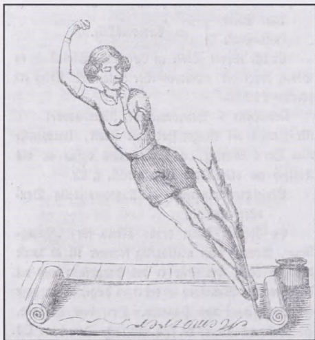
Satirisk tegning i Corsaren af den skrivende balletmester August Bournonville.

H.C. Andersen er blevet fejret året igennem med utallige initiativer og righoldige omtaler. Hans jævnaldrende og livslange ven, balletmester August Bournonville (1805-1879) er ligeså blevet behørigt fejret med en uges balletfestival på Det Kongelige Teater, hvor samtlige bevarede Bournonville-balletter er blevet opført. Dertil skal lægges en håndfuld Bournonville-udstillinger, der tilsammen har belyst hans kunst, balletskolen, privatpersonen og åndsmennesket bag balletmesteren.