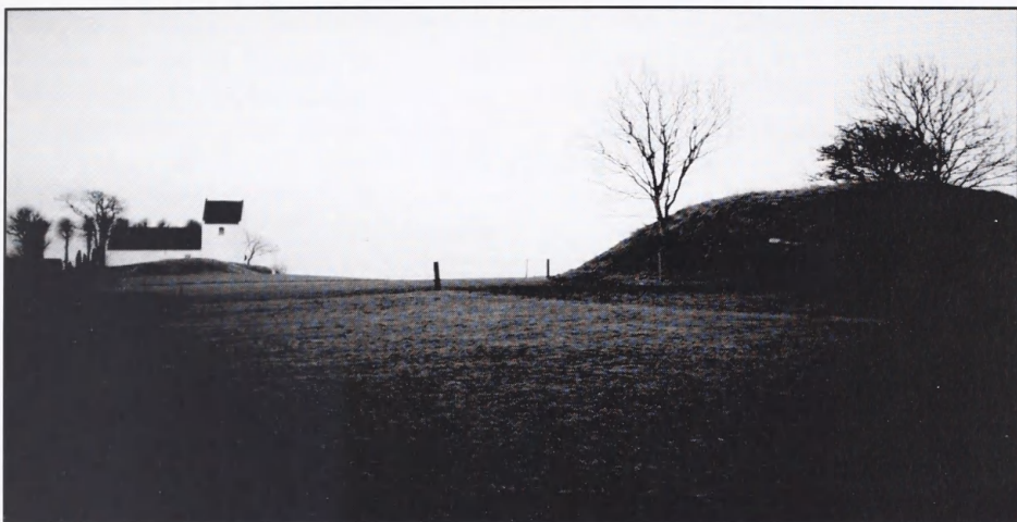
To høje ved Kirke Syv kirke, som på Martin A. Hansens skitse er angivet som A og B.

og mig bekendt er der her i Landet hidtil kun paavist eet Sted, hvor et større planlagt og ved Maaling bestemt Anlæg indgaar i et sikkert meget ældre stort Sakralomraade, nemlig ved Jelling. Det er mig heller ikke bekendt, at der ved selve Syv-Komplekset er Navne, der er typiske for Navnestof i store ældre Sakralomraader. Det maa dog nævnes, at der, foruden en Bavnehøj tæt Øst f. Kirkebyen, i Landskabet i Nærheden af Syv findes flere ejendommelige Navne med uklar Tydning. I Sydøst ved Syv Holme: Ørnebjerg, oprindelig nok Ornebjerg. I Nordvest ved Overgangen til Bymarkerne ved Øm, som fra gammelt har hørt til Syv. Sg.: Kumlegrd. og Hvilebjerg. 6