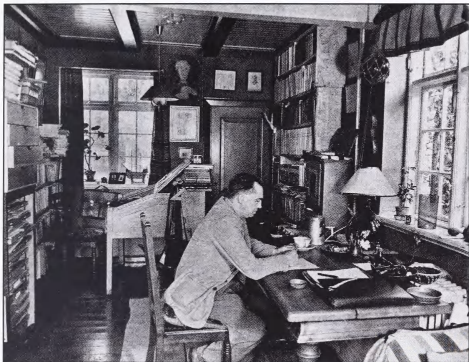
Forfatteren Martin A. Hansen i arbejdsværelset i „Salum“ i Allerslev.

de mest skelsættende begivenheder i Danmark, overgangen fra Odin til Jesus, er foregået som en typisk dansk, pragmatisk, blød og praktisk løsning, et religionsskifte i ro og mag med en glidende overgang.