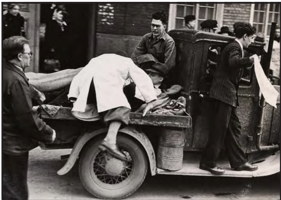
Sårede ved den franske skole transporteres derfra på en ladvogn (Dagbogen s. 69.305).

mer uden at være kommen noget til. Omsider fik man lavet et lille Hul ned til hende. En Redningsmand spurgte hende, hvorledes hun havde det, efter at han havde givet hende nogle Næringsmidler. Hun svarede med en sød lille Pigestemme: "Godt." Men hun var ked af, naar Redningsmanden gik fra hende. I Timevis maatte han holde i Haanden og lade Kammeraterne arbejde. Omsider kom hun fri, men hun manglede den ene Sko. "Aa, kunde jeg ikke faa den, saa vilde jeg være saa glad." Den var helt ny. Hun blev straalende henrykt, da Redningsmanden fremtryllede den. ... Fru Lassen kom ind og passiarede. 20 Hun fortalte om Bombe-Dagen. Hun havde set en ung Pige gnide Hænderne af Glæde og hørt hende raabe som et Jubelskrik: "Det er Englænderne. Saa nu bomber de det forbandede Shellhus. Aa, hvor er det godt." For resten