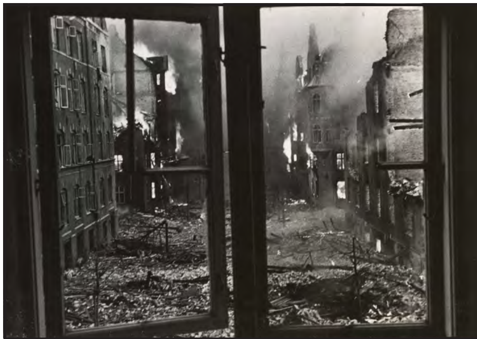
Kvarteret ved den franske skole fotograferet gennem et vindue efter det engelske bombardement (Dagbogen s. 69.298).