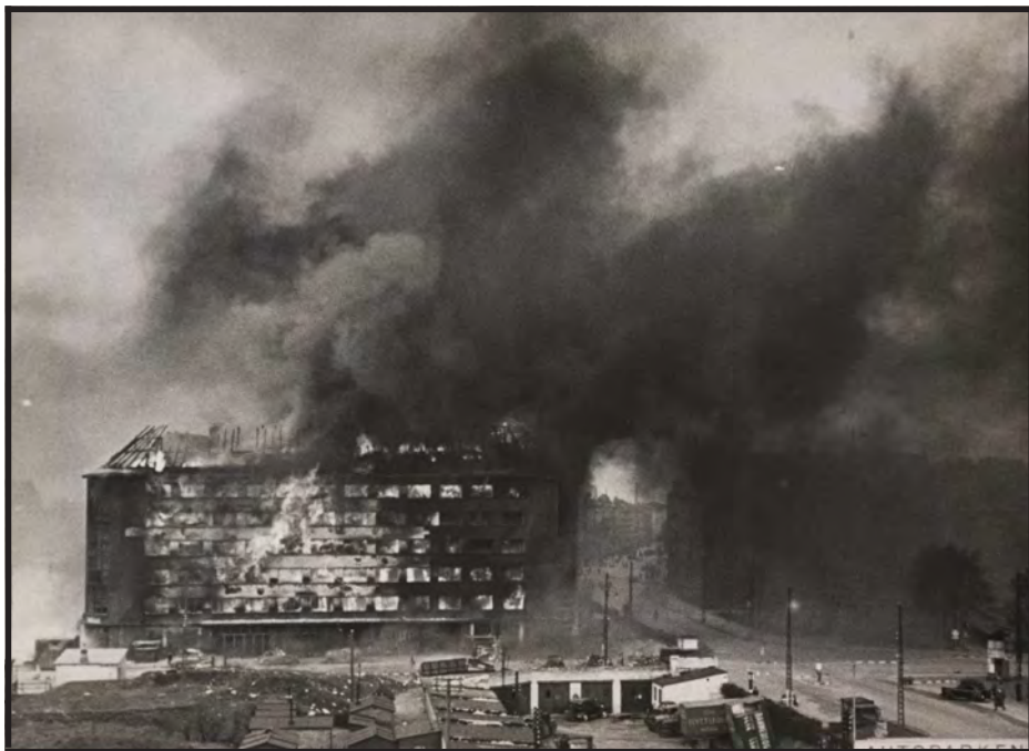
Shellhuset i flammer efter det engelske bombardement 21. marts 1945 (Dagbogen s. 68.170).