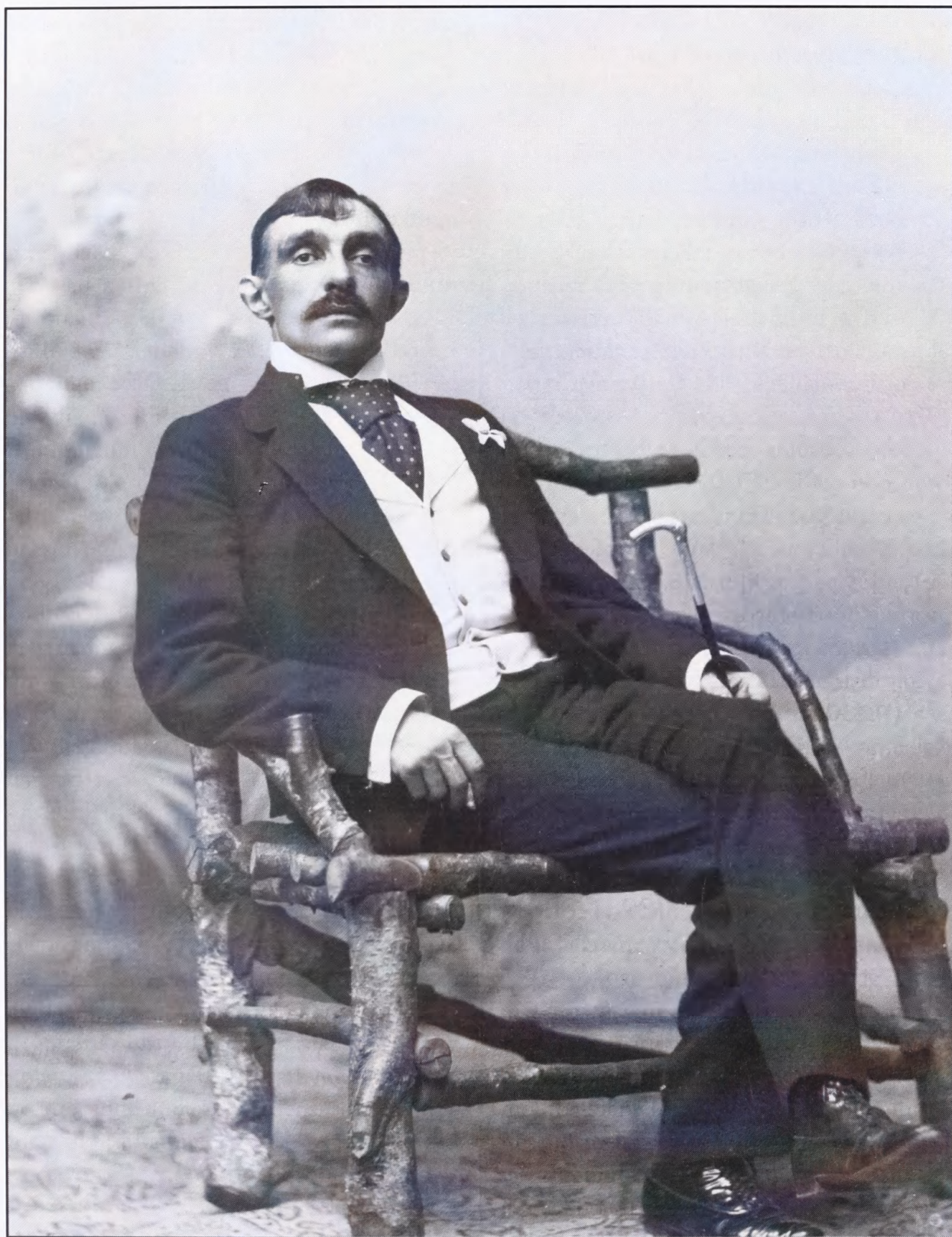
Den modne Herman Bang (1857-1912), omkring år 1900.