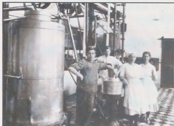
Mejerister ca. 1922. Billedet, der viser et eksempel på tidens nye maskiner, er hentet fra den virtuelle udstilling Industrialiseringen i Danmark fra 1870-1940 på adressen < www.kb.dk/kb/dept/nbo/kob/sepial/ >.

Siden 1995 har Det Kongelige Bibliotek produceret virtuelle udstillinger. Levende ord og lysende billeder , Industrialiseringen i Danmark fra 1870-1940 og Georg Brandes Skrivebord er et lille udpluk af overskrifterne på de 20 online temaudstillinger, der kan nås via adressen < www.kb.dk/web_udstillinger/ >.