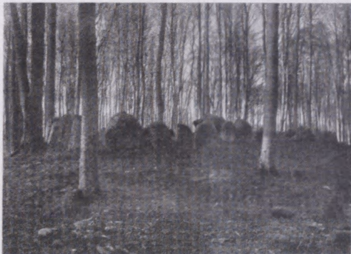
Overalt i Danmark finder vi Forfædrenes Grave.

Vi skal af med den Radikalisme, som systematisk har modarbejdet Danskhedens højeste Potens, Viljen til Forsvar, men som ikke skammer sig over at prale med danske Soldaterbreve. Vi vil have Lov til at anerkende den danske Hærs folkeopdragende Betydning, og der skal ikke pe-