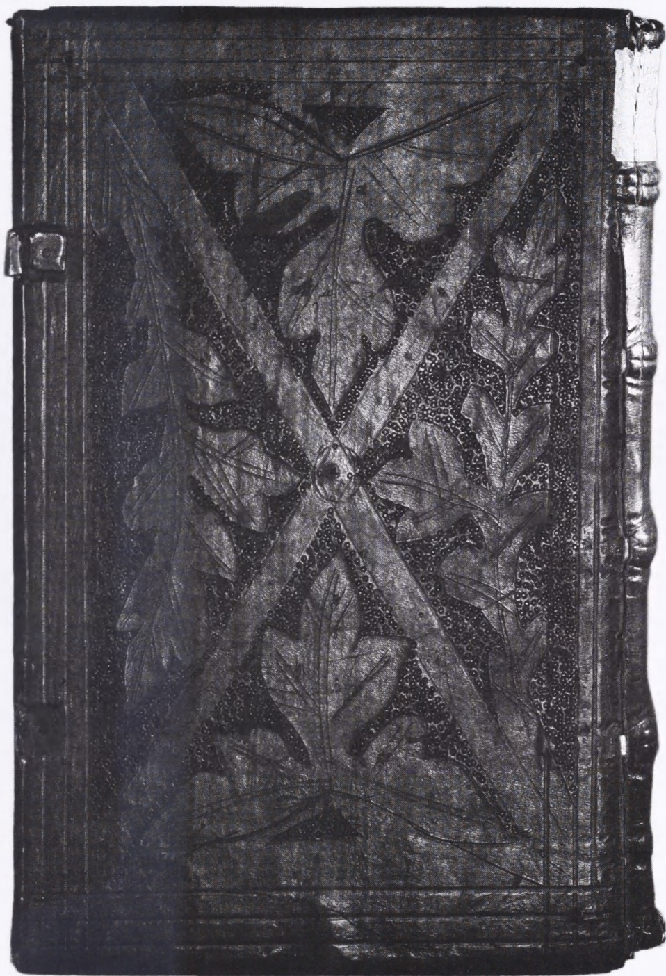
Bagsiden, der er opdelt af diagonale rammer, dækkes af fire enkeltstående blade. (Det Kongelige Bibliotek).