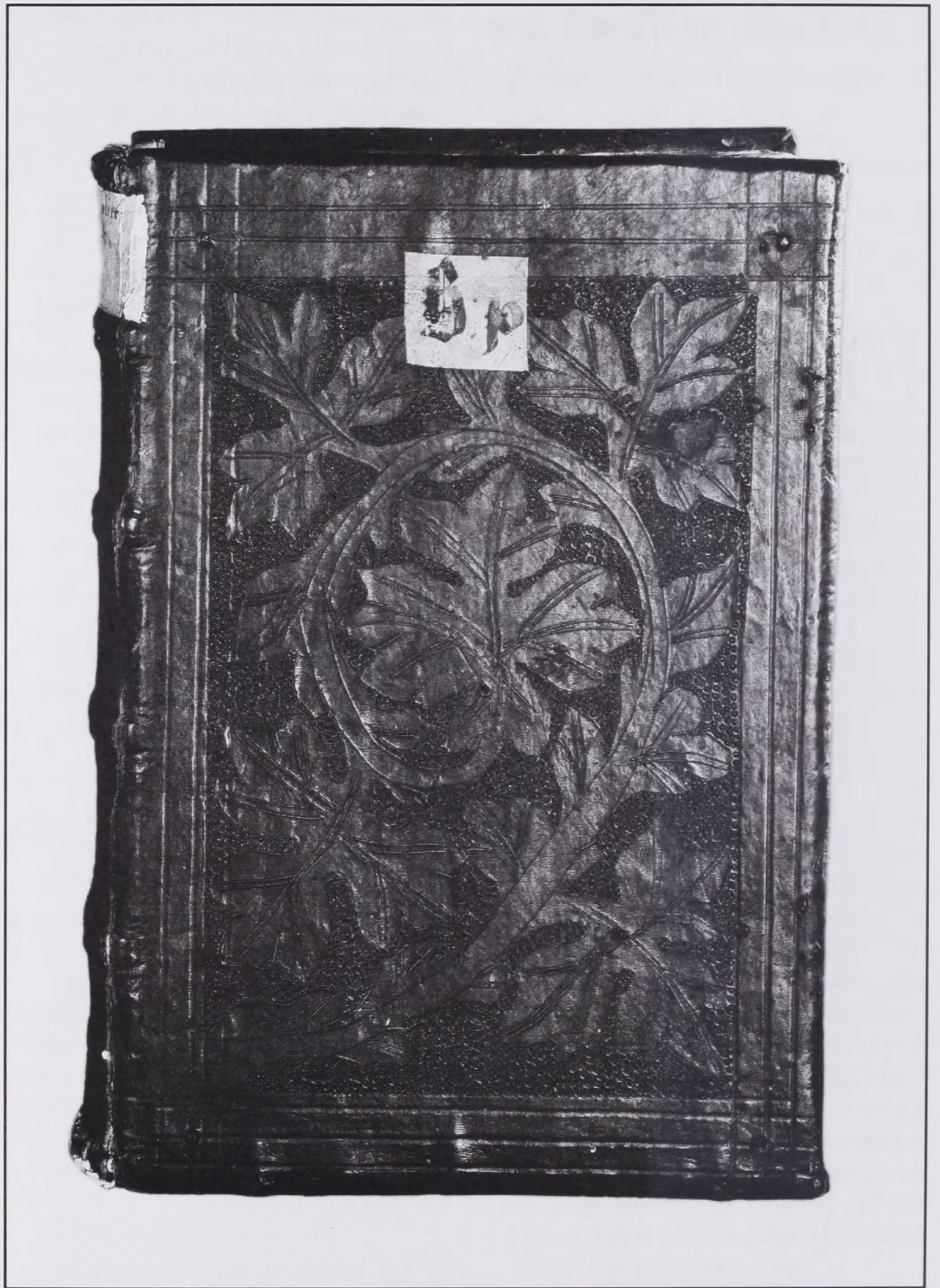
Bindet om GKS (Gammel Kongelig Samling) nr. 215. De stærkt indskårne og fligede blade dækker inden for en yderramme forsiden i én enkelt slynget, bladbesat gren. (Det Kgl. Bibliotek).