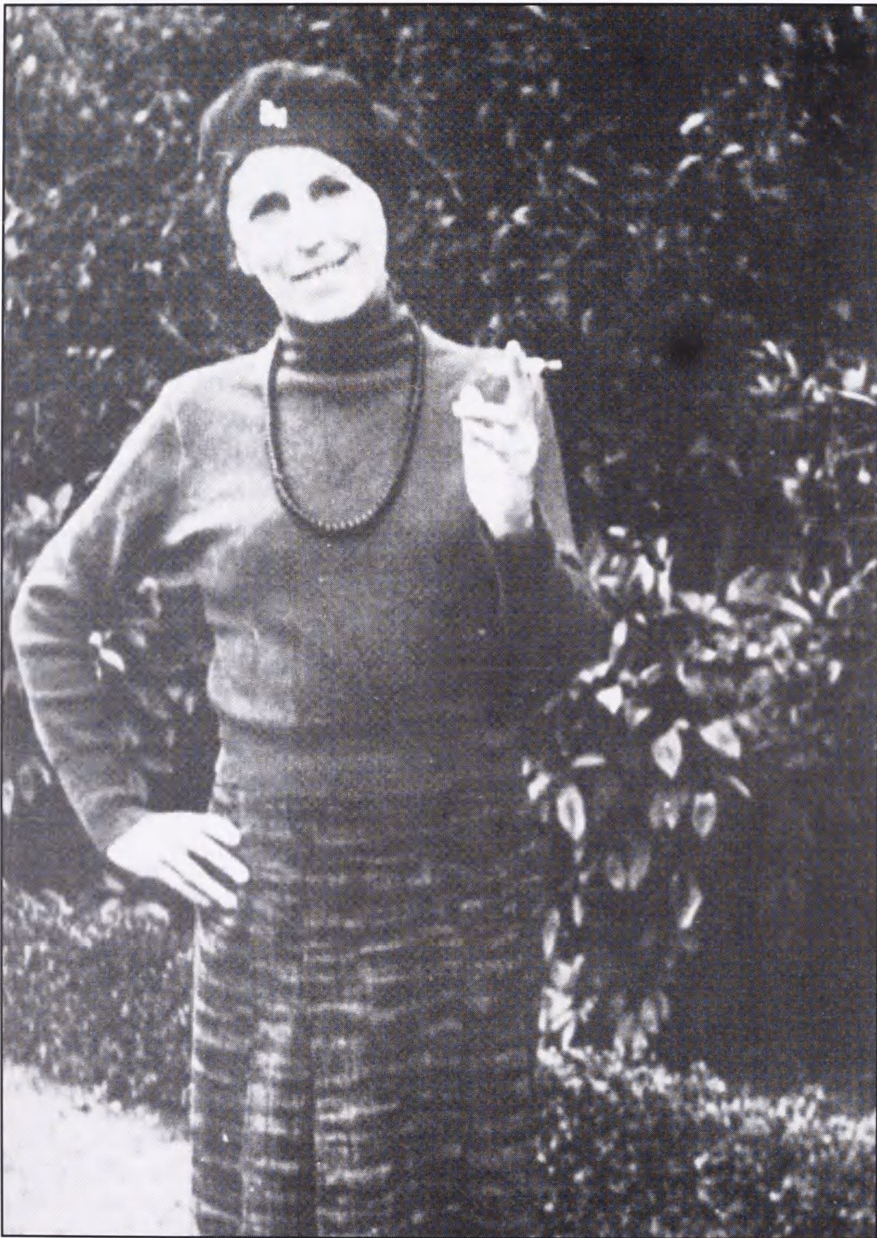
Efter forfatterens identitet var afsløret blev dette amatør billede af Karen Blixen brugt som pressefoto i England.