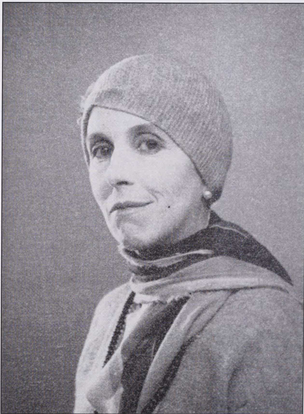
Karen Blixen (1885-1962), fotograferet i 1934. Samme år udkom forfatterens bog Seven Gothic Tales i USA under pseudonymet Isak Dinesen.