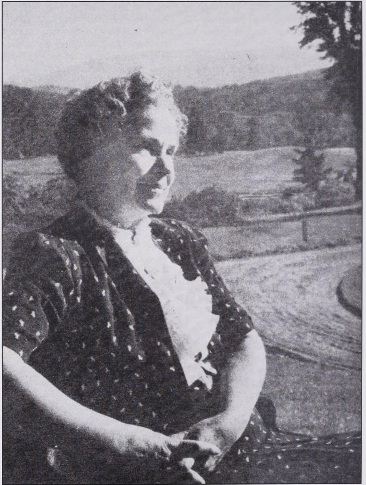
Forfatterinden Dorothy Canfield Fisher (1879-1958), der formidlede Karen Blixens kontakt med den amerikanske forlægger Robert K. Haas. Fotografi fra ca. 1950.