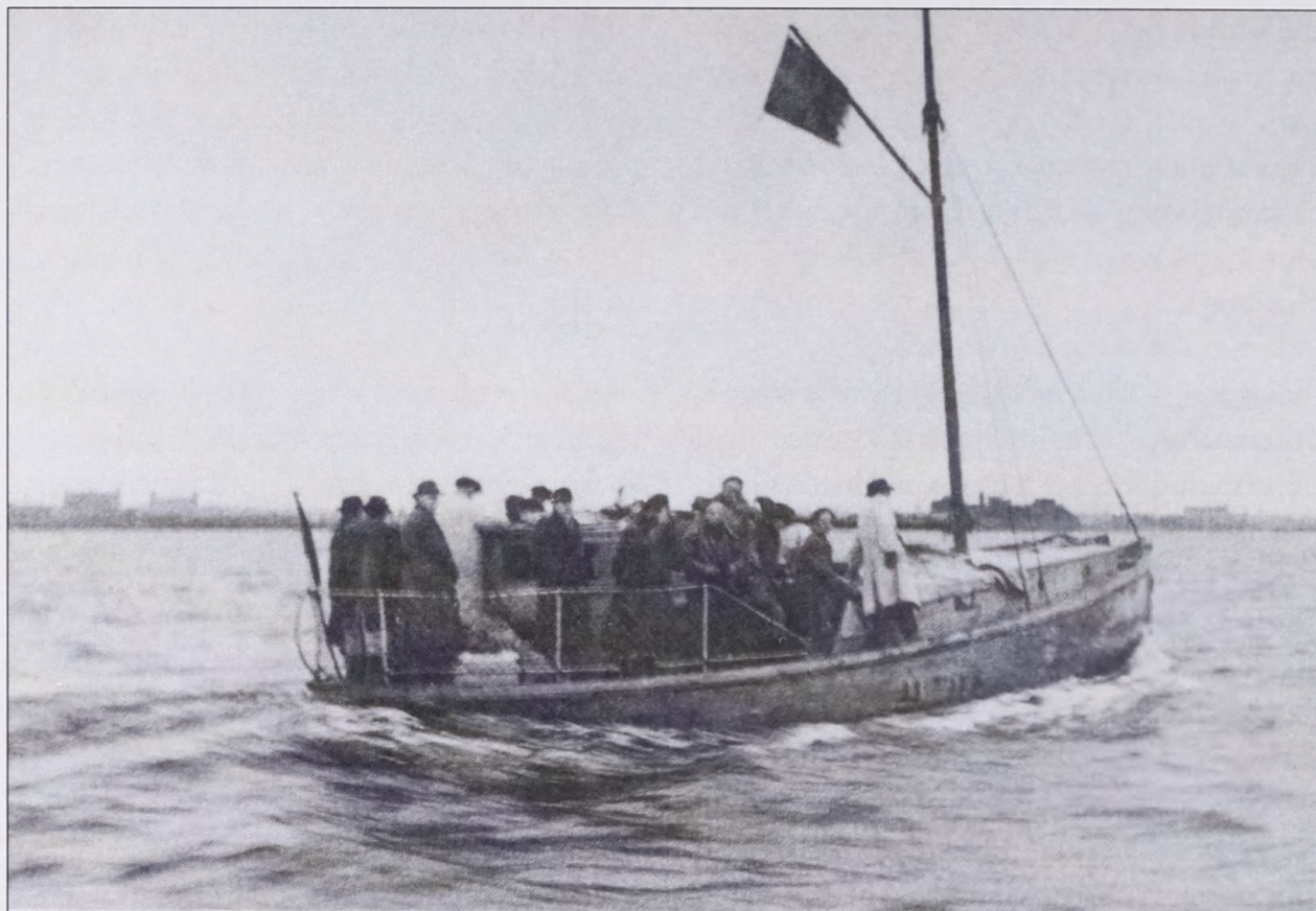
Dette billede optræder i flere fremstillinger om oktober 1943 som en angiveligt sigende dokumentation for jødernes flugt til Sverige. Imidlertid viser billedet verdenspressens sejlads fra Malmø til København ved kapitulationen i maj 1945. Mangel på dramatisk billedmateriale fra flugtdagene i oktober og manglende omhu giver anledning til mangfoldige misforståelser, både i den danske og udenlandske litteratur.