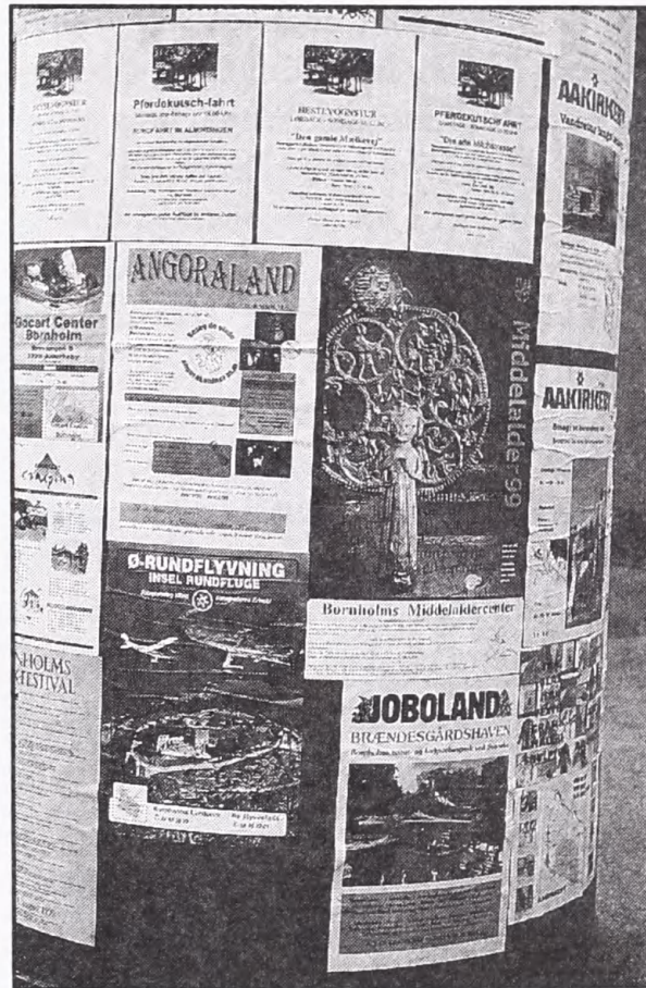
Plakatsøjle, Bodernne Vandrehjem, Bornholm.

Derfor får vi også de syv planeter og hvilke indvirkninger de har på menneskelivet. Saturn, som repræsenterer bly, siger f.eks. at han er gammel, kold og uden skæmt, hadsk og glemmer al forsigtighed. Hans børn er fulde af nid og had, "metal og blye min handel mon være". Er man født i Stenbukkens tegn er man af Saturns natur, sangvinsk, hed og våd. Altså har det kunnet betyde lidt af hvert, må man tro, at sætte hans metal bly på sit skrin! En "planetbog" siger Saturn er påholdende, en anden at i hans time er det godt at sælge og købe allehånde vægtige ting, især alle metaller.