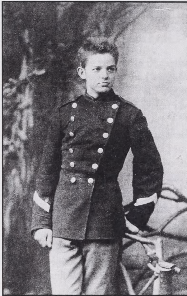
Carl Nielsen, 1882.