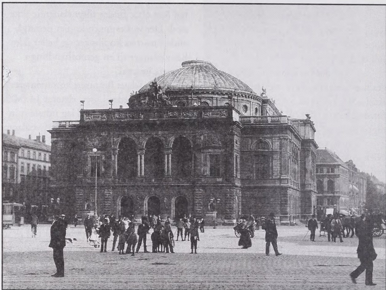
Det kgl. Teater, ca. 1900.