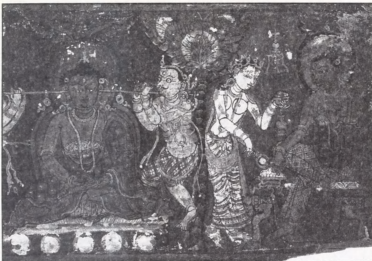
Bemalede dækplader af træ til nepalesisk håndskrift på sanskrit fra 1511. Illustrationerne gengiver scener fra betydningsfulde episoder i Buddhas liv.

læren og munkereglerne af indviede munke. Den egentlige indvielse ( upasampada ) fandt sted under højtidelige former, når novicen var 20 år gammel eller efter en prøvetid på mindst fire måneder.