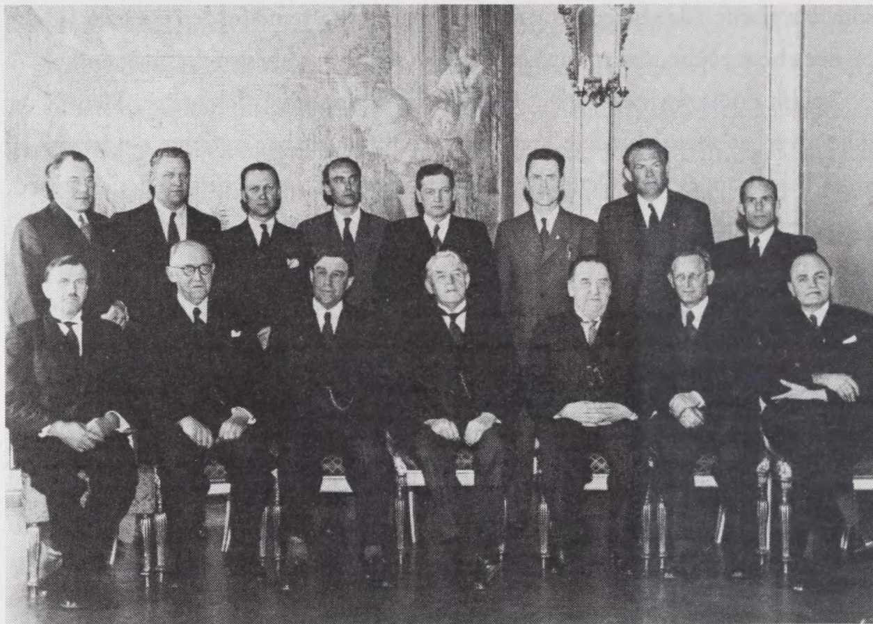
Befrielsesregeringen maj 1945 med lige dele repræsentanter for de politiske partier og modstandsbevægelsen. Enkelte ministre, bl.a. John Christmas Møller, er ikke kommet med på billedet.

der havde holdt på den forkerte hest. Dette skal jeg ikke gå nærmere ind på, men blot fremhæve, at det centrale begreb var landsforræderi. Processerne kunne derfor ikke begrundes juridisk eller blot pseudojuridisk, medmindre man forudsatte, at Danmark havde taget del i krigen. På allieret side, naturligvis.