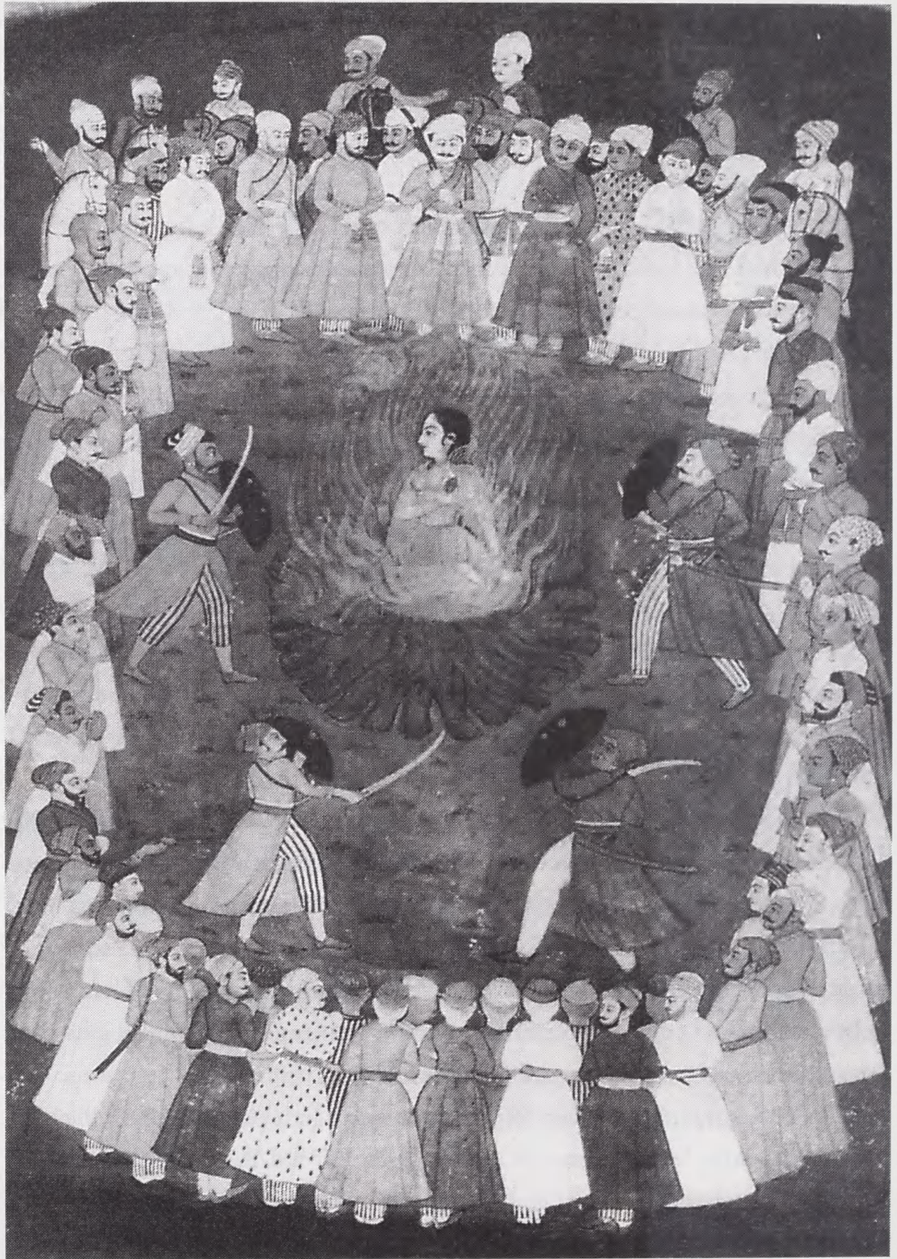
Billedet af en enkebrænding er fra begyndelsen af 1700-tallet og hænger nu i Bombay.