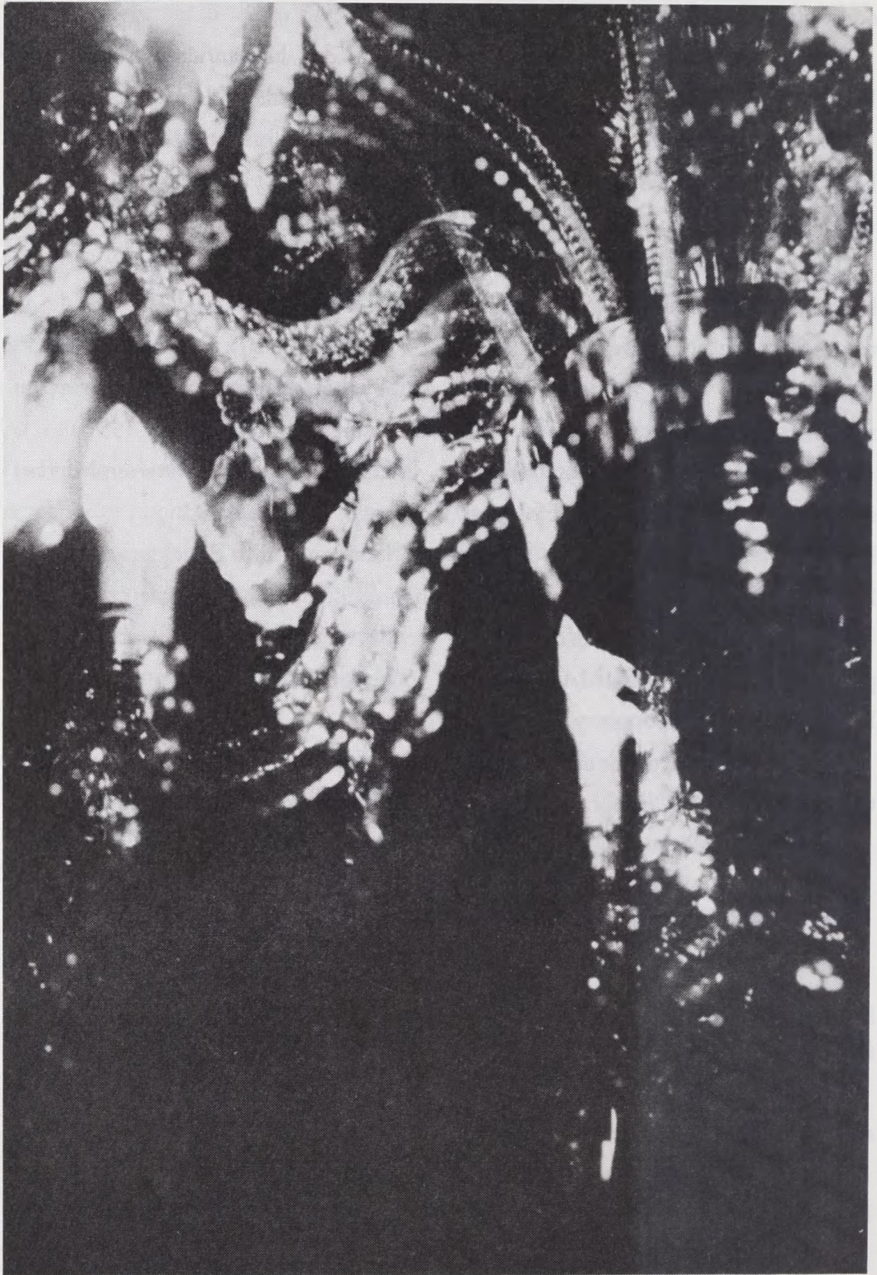
Det kongelige Biblioteks julekort 1995.