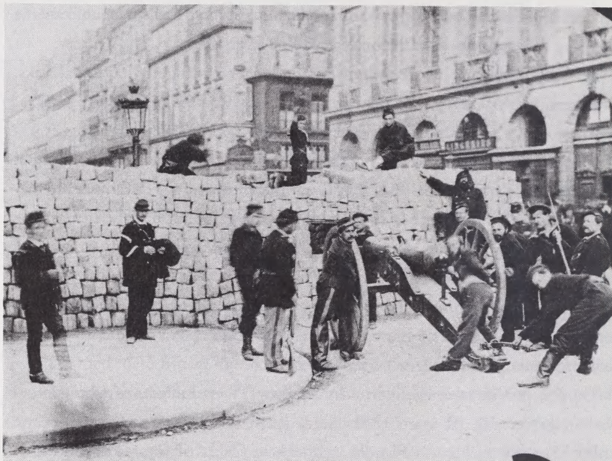
Under Pariserkommunens korte levetid lod dens forsvarere sig gerne fotografere på barrikaderne. De kommunardere, som Thiers' politi siden kunne identificere ud fra billederne, blev henrettet efter Kommunens fald i maj 1871.

blev lagt i ruiner, før revolten var nedkæmpet, skorter det ikke på motiver: F.eks. nedbrændte Palais des Tuileries, mens Palais Royal og Palais de Luxemburg slap mere nådigt fra flammernes rasen.