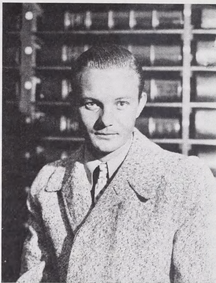
Forfatteren Mogens Klitgaard (1906-45). Her på arkivbesøg under forstudierne til de historiske romaner De røde Fjer og Ballade paa Nytorv, som begge udkom i 1940.

Småborgerskabet og dets socialpsykologi i 30'erne og 40'erne er et dominerende tema i Klitgaards forfatterskab. Det var her, Klitgaard leverede en stor del af sin samfundskritik. Ikke ulig sin egen situation følte Klitgaard med „den lille mand“, som blev holdt nede af samfundets og opdragelsens velindrettede mekanismer. Gennem Klitgaards bøger beskrives og analyseres den forvirring og opløsning, der ramte småborgerskabet, som en følge af de sociale strukturforandringer, krisen i 30'erne medførte. Det var dog ikke kun samfundets behandling af „den lille mand“, som Klitgaard kritiserede. Han leve-