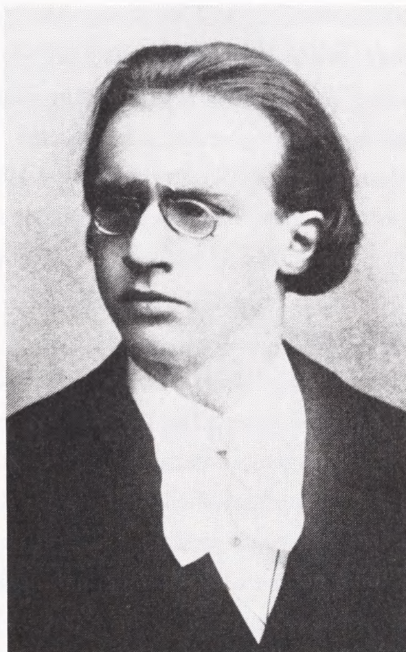
Herwarth Walden i 1903.