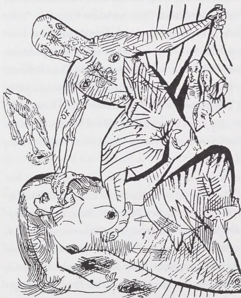
Zeichnung von Oskar Kokoschka zu dem Drama Mörder, Hoffnung der Frauen