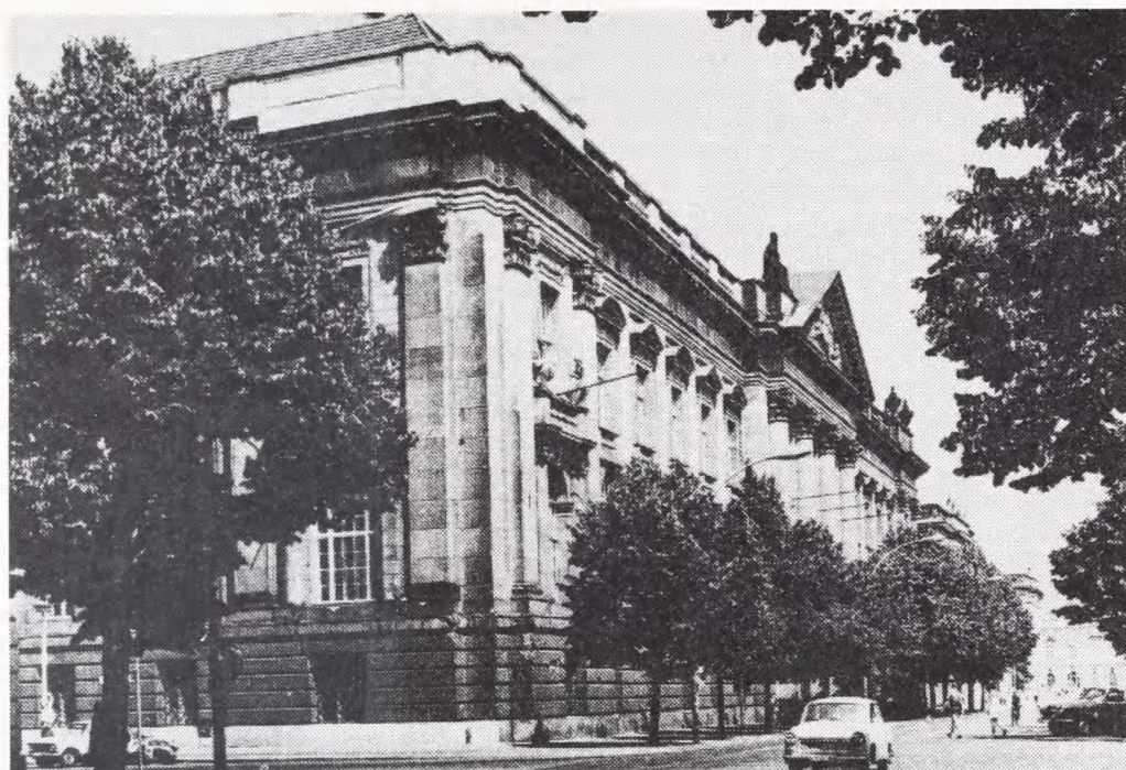
Staatsbibliothek zu Berlin. Biblioteket var i DDR-tiden universitetsbibliotek for Humboldt-Universität.