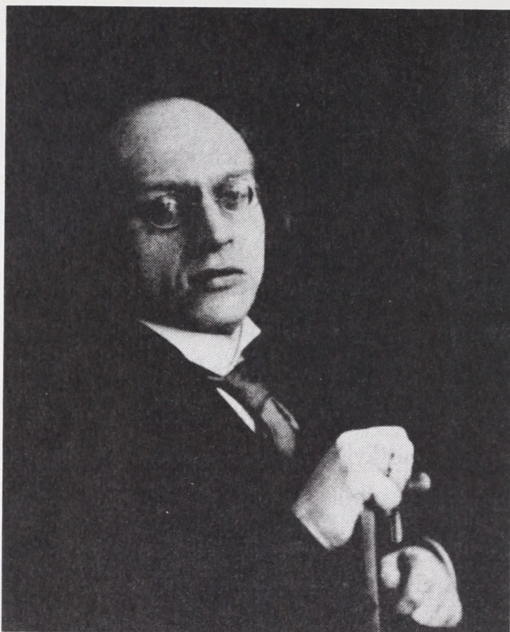
Herwarth Walden i 1915.

støttes eller ledsages af den af Walden foreslåede recitator vides ikke. Johannes V. Jensen udsætter afgørelsen i første omgang, fordi han kan stå foran vigtige afgørelser, der vil forhindre ham i at rejse, i anden omgang afslår han, fordi han har fået grund til at tro at han vil misbruge et tysk publikums tålmodighed på grund af ukyndighed i tysk.