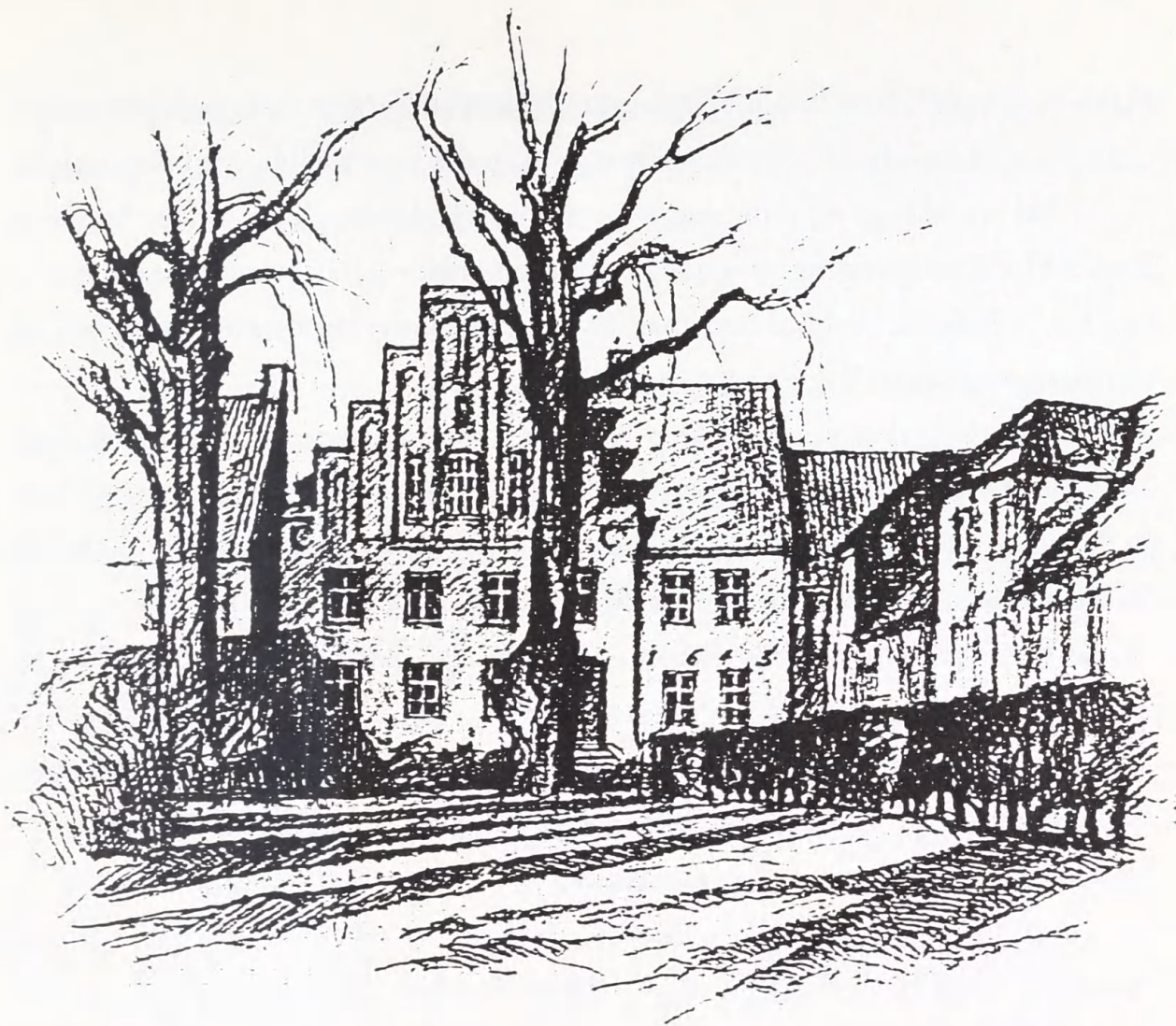
Stiftsbibliotekets første bolig, Sct. Mogensgade 9 (med årstallet 1643). Tegning af Johannes Bæch.

20.000 bind. (Der oplyses også, at udlånet i samme år var på 100 bind.) På den tid var den lærde A.S. Poulsen biskop (1901-21). Han var i særlig grad interesseret i at anskaffe litteratur om Luther; iøvrigt blev også i hans tid ca. 800 bind overvejende nyere litteratur skænket til det i 1917 oprettede Viborg Centralbibliotek.