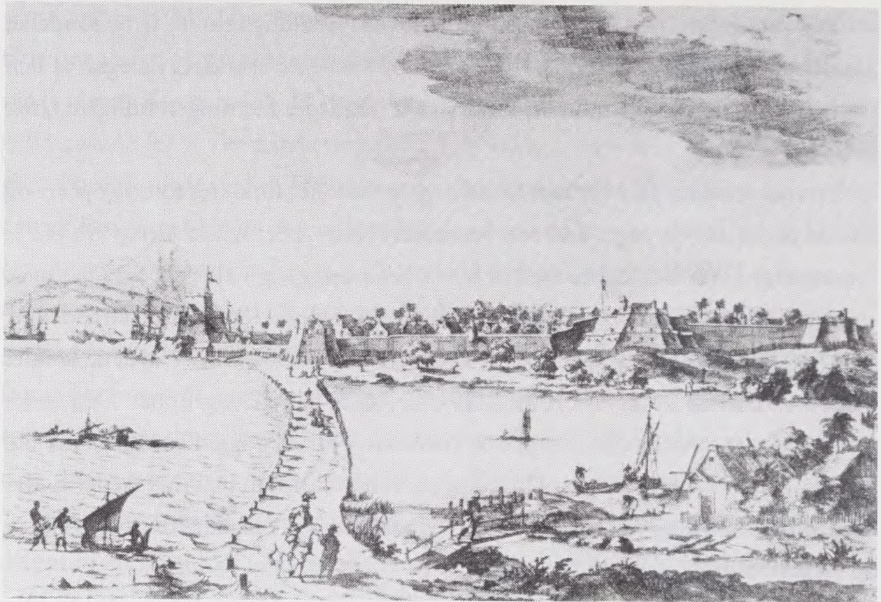
Ill. 3. Prospekt af Galle på Sri Lanka (Ceylon). Tegningen viser det portugisiske forsvarsanlæg, som senere hollænderne genopbyggede efter samme mønster, men større. Fra W.A. Nelson: The Dutch Forts of Sri Lanka . 1984.

Særligt interessant er Trellund-kortets afbildning af de bevarede dele af den gamle mur. De to gamle rondeller er fremstillet som murede sekskantede tårne i to stokværk placeret midt i bymuren med tre sider mod graven og tre mod byen. Den ene rondel har en lidt mere enkel udformning af sine skydehuller end den anden, der skulle flankere et stumpvinklet knæk på bymuren. Den har i begge stokværk - og på alle de tre sider, der kan ses på prospektet - parvise glugger. På rondellernes krenelerede top ses på begge bastioner to opmurede skilderhuse. Et ind mod byen og ét ud mod omegnen. Den uregelmæssige bastion ved stranden er her fremstillet som et meget stort syvkantet værk, der er forbundet med yngre værker langs stranden. Den synes ikke at have skydehuller eller lignende, til gengæld er dens top meget kraftigt bestykket med 22 kanoner og 1 mortar, hvis man skal tro textoplysningerne på Trellunds kort.