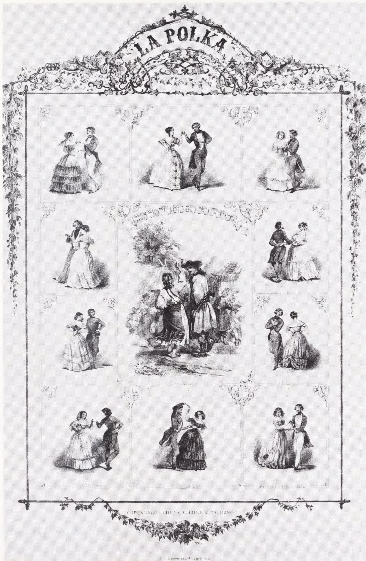
Pariser-dansen Polka introduceredes i Danmark midt i 1840'erne. Trinene kunne bl.a. læres ved hjælp af denne instruktionstavle.