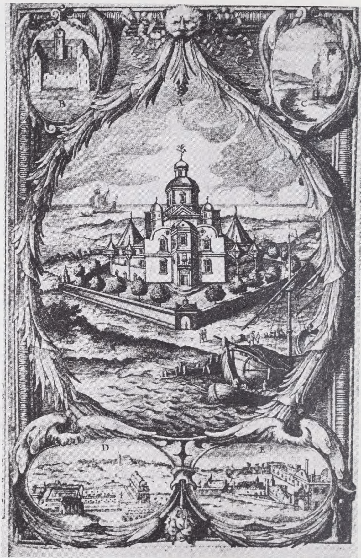
I Historia coelestis jussu S.C.M. Ferd. III. edita, complectens observationes astronomicas varias ad historiam coelestem spectantes , Emmrich, Regensburg 1672, findes dette billede af Uraniborg, med hjørnebilleder af slottet i Wandsbeck, slottet i Benátky nad Jizerou, Bøhmen, af Belvedere i Prag og af vicekansler Jakob Curtius' ejendom i Prag, Brahes sidste bopæl.