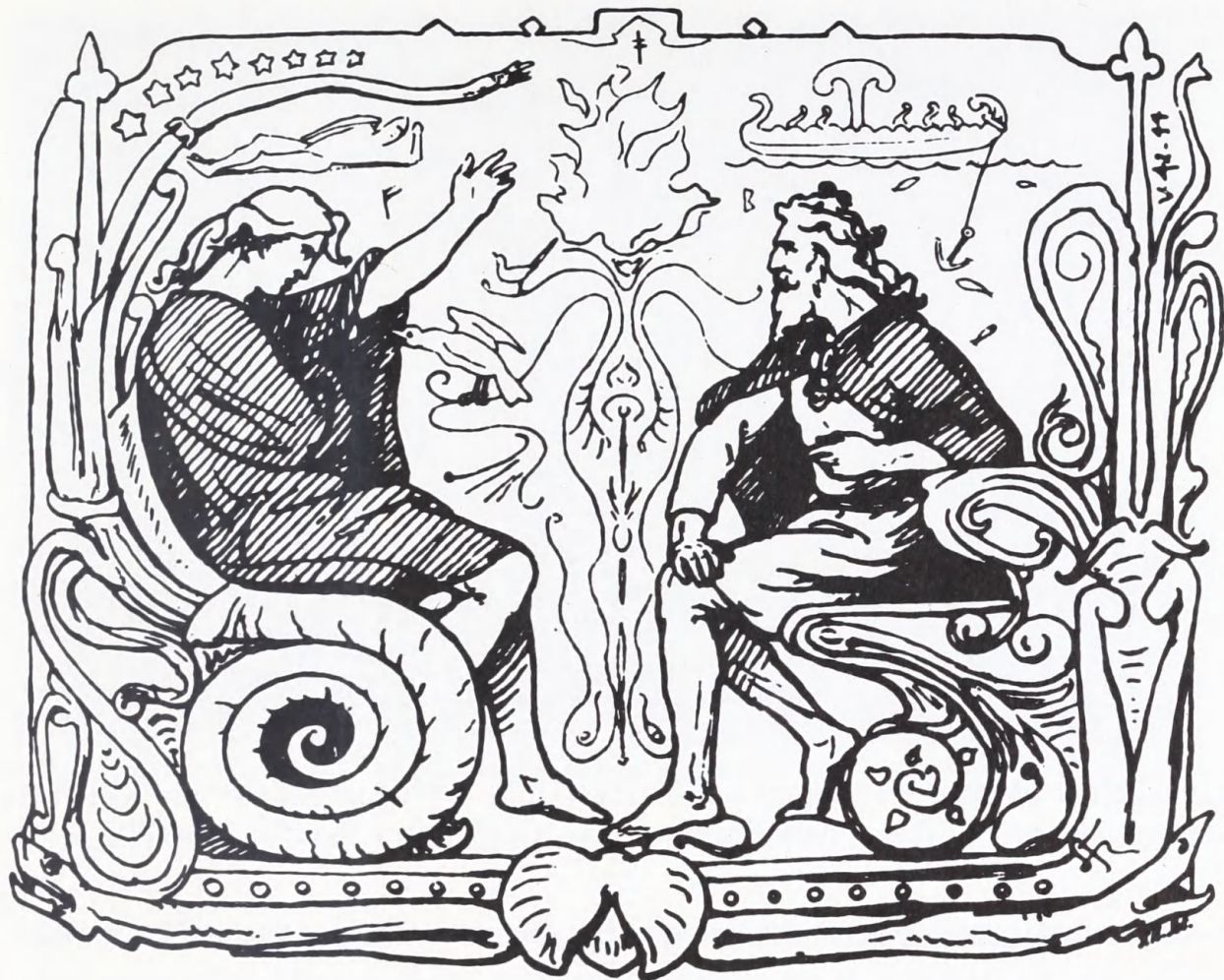
L. Frølich: Dan og Danp i samtale. Den ældre Eddas gudesange , 1895.

indtil 1892 troede, at lurene blev brugt.