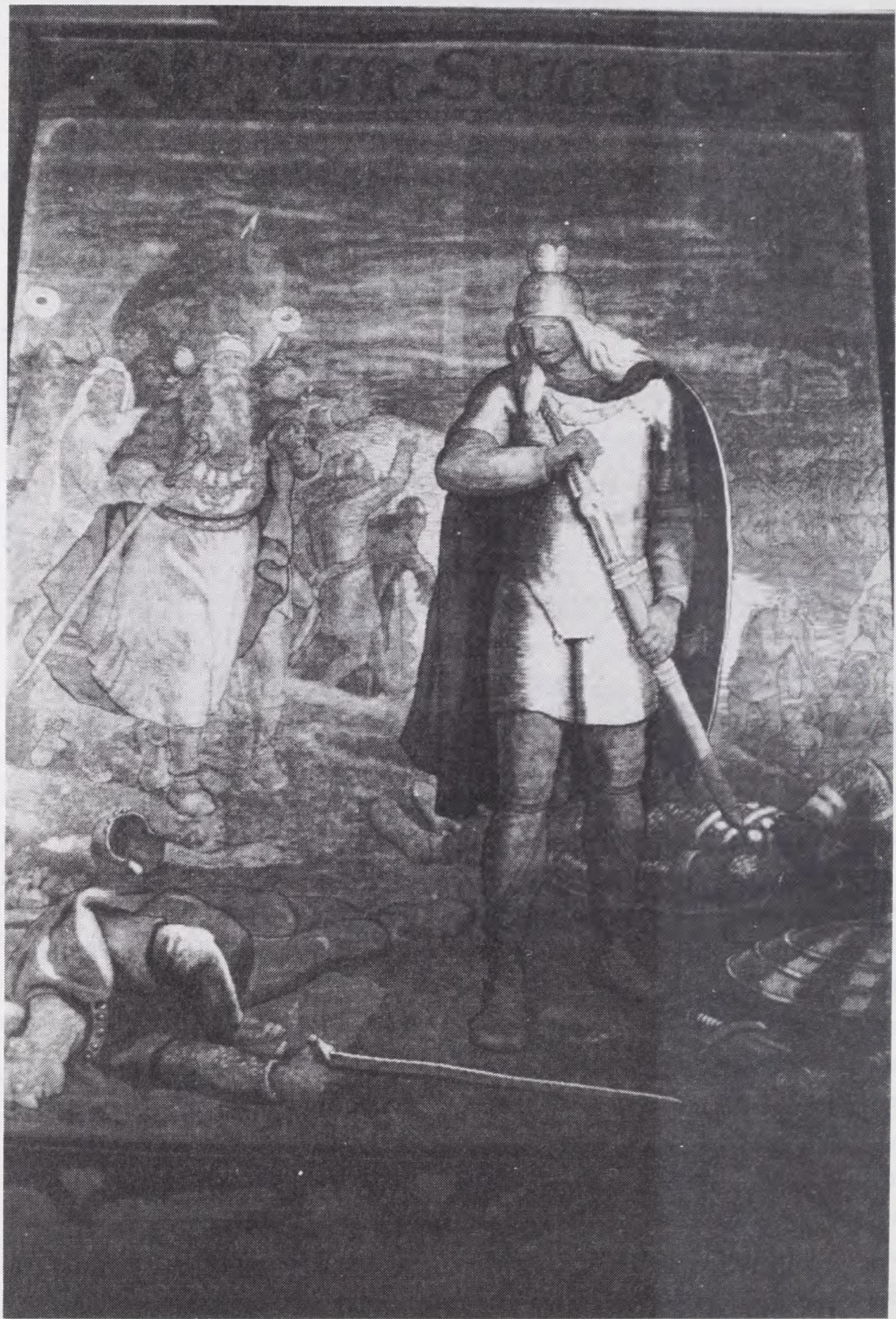
L. Frølich: Uffe hin Spage. Gobelin på Københavns Rådhus. Gertrud Permin foto.