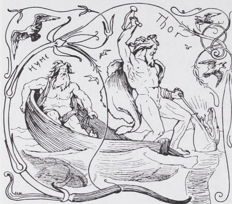
L. Frølich: Thors fiskedræt. Den ældre Eddas Gudesange , 1895.

en tegning af disse miniature-økser. Mærkelig nok er det ikke tilfældet. I stedet optræder Thor sædvanligvis med mærkelige fantasi-hamre.