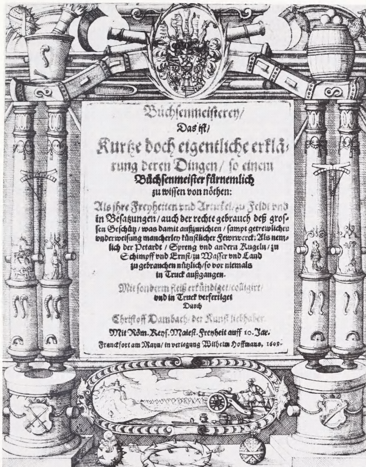
Christian IV's eksemplar af Christoph Dambachs Büchenmeisterei. Frankfurt 1609. 4°. Indbundet i et dekoreret pergamentbind med Christian IV's kronede monogram på forsiden.