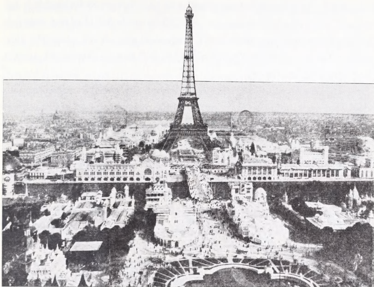
"Det moderne Fremskridts Aarhundrefest" - Verdensudstillingen i Paris 1900. Fra katalogen L'Exposition du Siècle, 1900.

stadigvæk den industrielle revolution i England, der befinder sig på heltesiden. Kort tid efter udsendelsen af bogen skifter Johs. V. Jensen sit ideal til at være USA. Besyngelsen af USA lå latent i Den gotiske Renaissance, men udfoldes først sidenhen i forfatterskabet bl.a. i romanerne Madame d'Ora (1904) og Hjulet (1905), hvor handlingen udspiller sig i henholdsvis New York og Chicago. 5