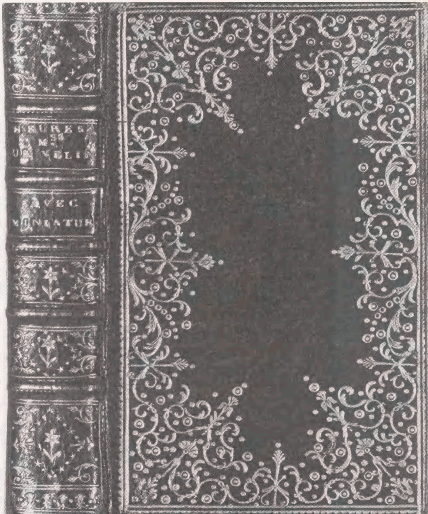
Olivengrønt maroquinbind dekoreret med bred guldtrykt kniplingsbort udført af den franske bogbinder Nicolas Denis Dérome le jeune (1731-88). Et eksempel på de mange boghistorisk interessante bind, der findes i Håndskriftafdelingen. NKS 34 8°