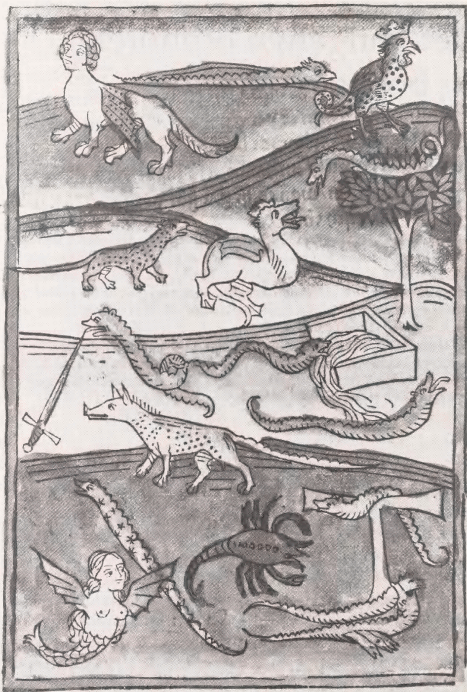
Konrad von Megenberg: Buch der Natur. Augsburg 1478. Denne naturhistoriske encyclopædi er sandsynligvis den første trykte bog med illustrationer af dyr. Inc.Haun. 2423.