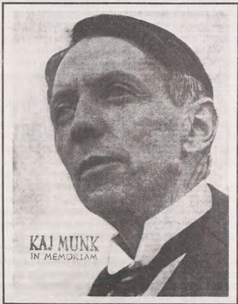
KAJ MUNK IN MEMORIAM

DANMARKS STORE SØN KAJ MUNK SIDE 2 DANMARK OG KRISTUS, EN NYTAARS PREDIKEN AF KAJ MUNK SIDE 3 GESTAPO MYRDEDE KAJ MUNK, POLITIUNDERSGØGELSEN INDSTILLET SIDE 4 BILLEDER FRA KAJ MUNKS GRIBENDE JORDEFÆRD SIDE 5 SKANDINAVISKE MINDEORD SIDE 6