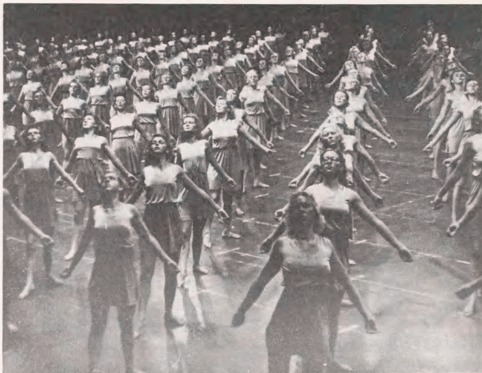
Niels Bukhs 'sommerpiger'. Her fra en opvisning i KB-Hallen i 1941.