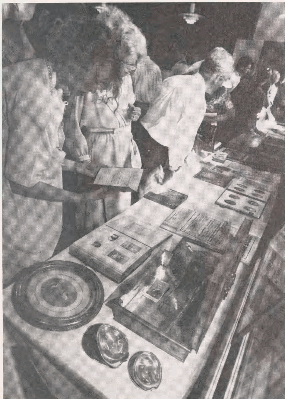
Det lange bord i Karlebo Forsamlingshus blev fyldt op med cirkus-minder: fotografier, scrapbøger, programmer, ridepiske og polerede hestehove.