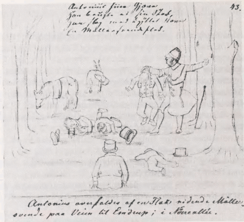
“Antonius overfaldes af en Flok ridende Möllersvende paa Veien til Emdrup; i Nörreallée”. Tegning af Fritz Jürgensen i hans skitsebog, erhvervet til Håndskriftafdelingen.

Iøvrigt har afdelingen erhvervet en række andre samlinger og enkelte breve og manuskripter, f.eks. fra følgende: Tom Kristensen, Martin A. Hansen, Jørgen Bukdahl, William Heinesen, C.F. Weyse, N.F.S. Grundtvig, Peter Freuchen, Thor Lange, Thit Jensen, B.S. Ingemann, Chr. Kongstad Petersen, Paul V. Rubow, T.S. Eliot, Graham Greene.