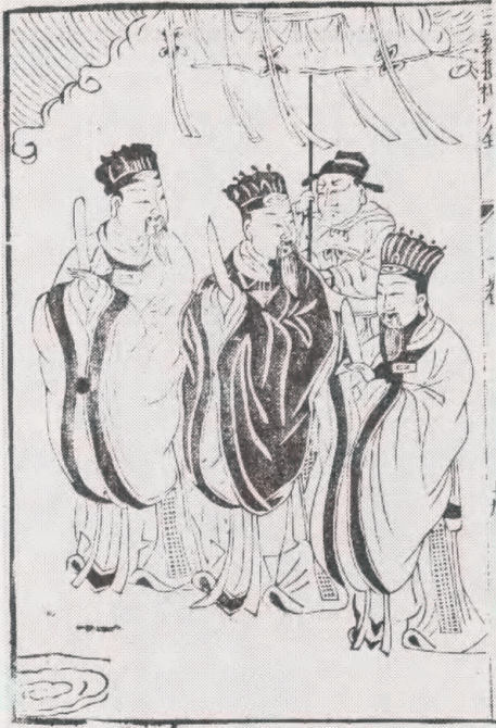
Fig. 4 : Sanyuan dadi (19,2x12,2 cm). Tidsaspektet af Sangan dadi, herskerne over himmel, jord og vand. De bringer lykke og dyd samt holder ulykker væk. Bloktryk. Fra Sanjiao yuanliu shangdi fo shuai soushen daquan . 19. årh. OA 102-5.

Den kinesiske menigmand og -kvinde har fra tidlig tid altid ønsket at skabe en fredelig og økonomisk sikker tilværelse uden indblanding fra de rige i samfundet og diverse regeringer eller magtfulde mænd. For at sikre sig mod både de naturskabte og menneskeskabte katastrofer opbyggede kineserne en hel skare af guder og hellige væsener, der skulle hjælpe dem i deres vej gennem livet på en gunstig måde. Mange kinesere hentede hjælp fra de guder og deres assistenter, de anså for kraftfulde og nødvendige i en given situation, uanset hvilket religiøst tilhørsforhold guderne havde. Det betød f.eks., at kvinder, der ønskede afkom (helst mandligt til at fortsætte slægten), henvendte sig til den buddhistiske barmhjertighedsgudinde, Guanyin (fig 3), eller til den folkelige frugtbarhedsgudinde, Tianxian Niangniang (der i tidens løb blev blandet sammen med Guanyin), for at opnå graviditet. Når det drejede sig om begravelser hentede kineserne hjælp fra de daoistiske guder og præster. Det vil sige, at kineserne var og er meget praktisk anlagt: hvad der anses for mest effektivt tages i brug uden skelen til ideologier.