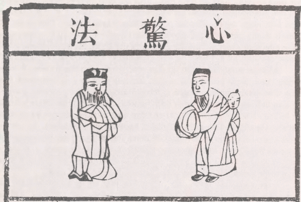
Fig. 8 : Illustration i forbindelse med forklaringen af "Metode til at lære hjertets faresignaler" (7x10,3 cm). Bloktryk. Fra Zengfu tianqing daquan . 1771. OA 102-272b.

stem, således at Jupiter hæftes til øst, Mars til syd, Venus til vest, Merkur til nord og endelig står Saturn ved centrum. Alt dette er selvfølgelig en vigtig del af håndbogen.