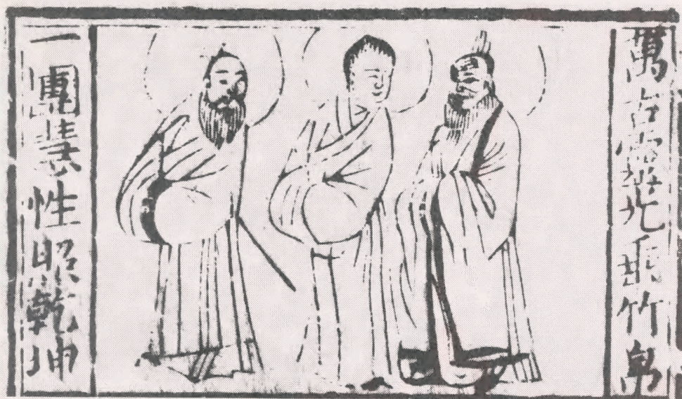
Fig 5 : Sanjiao dadi (6,6x8,8 cm). Denne treenighed bringer rigdom, forfremmelse i ens karriere og giver langt liv. Bloktryk. Fra titelbladet på Sanjiao yuanliu shangdi fo shuai soushen daquan . 19. årh. OA 102-5.

slutningen af det 19. årh., men teksten og illustrationerne stammer helt tilbage fra det 14. årh. under Yuan dynastiet. Bogen er et meget talende udtryk for en holistisk opfattelse af verden. Den forsøger at sammenkæde alle typer af guder og ånder i én religion. Dog er resultatet her ikke synkretistisk, da bogen beskriver hver religion for sig med de tilhørende guddommelige væsner. Alle omtalte væsner har en helsides afbildning (19 x 12 cm.) med mere eller mindre fyldestgørende oplysninger om deres særlige evner og hjælpsomhed.