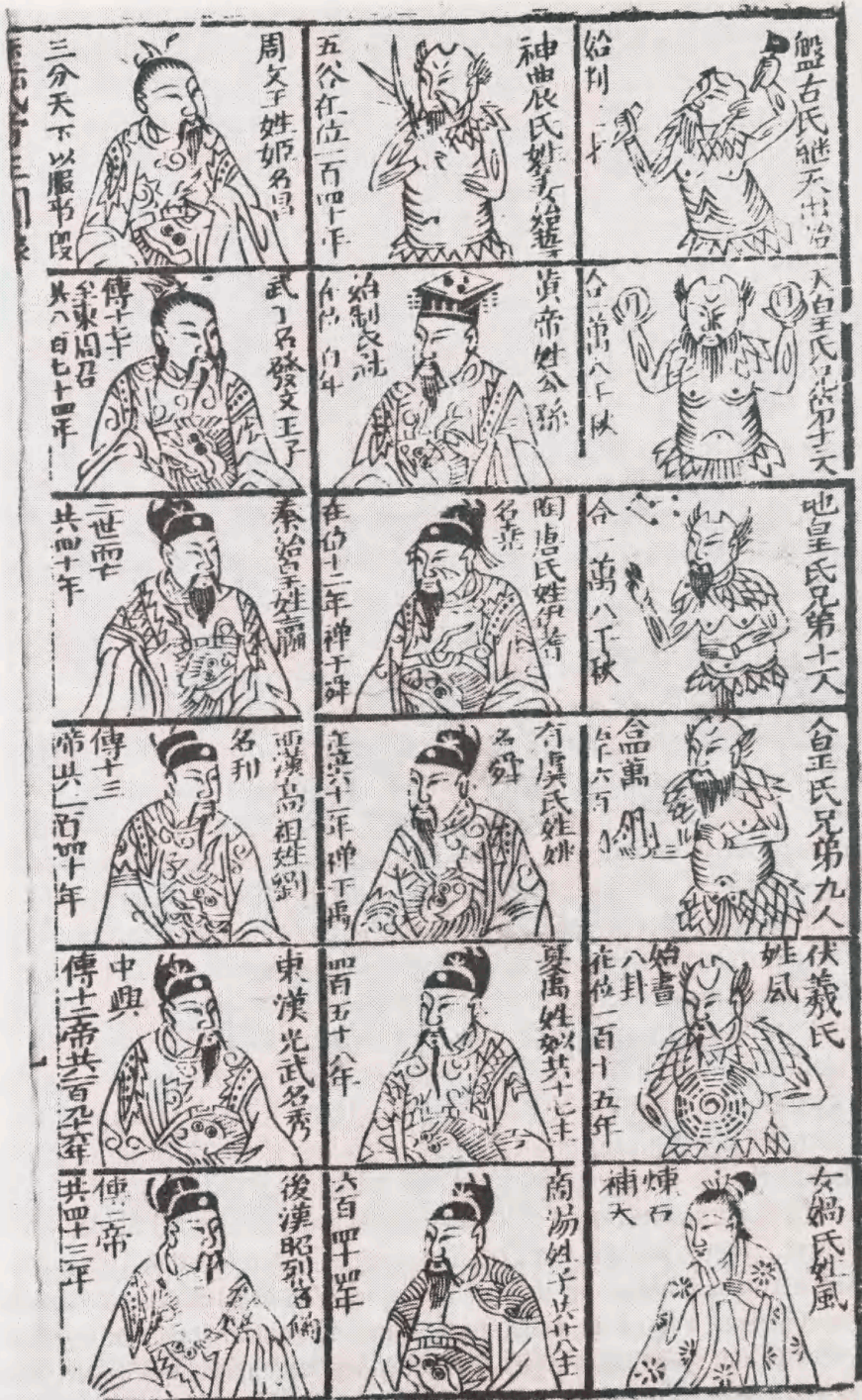
Fig 7 : "Portrætter" af de mytiske herskere til den første kejser af Østlig Han dynasti (25-220 evt.). Bloktryk. Fra Jujia baibei bu jiuren . 19. årh. OA 102-102.