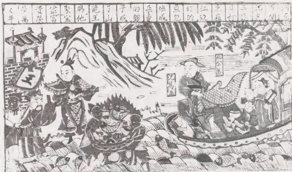
Fig 2 : Familiefaderen forsøger at indfange mere velstand til familien (24,2x41,5 cm). Bloktryk i farver. Fra Shandong Weixian Yangjiabu muban nianhua . 1983. OA 102-1985-375.

blandt kineserne, og OA låner ofte de nye optryk ud til kinesiske studerende og forskere, der har længere eller kortere ophold i Danmark.