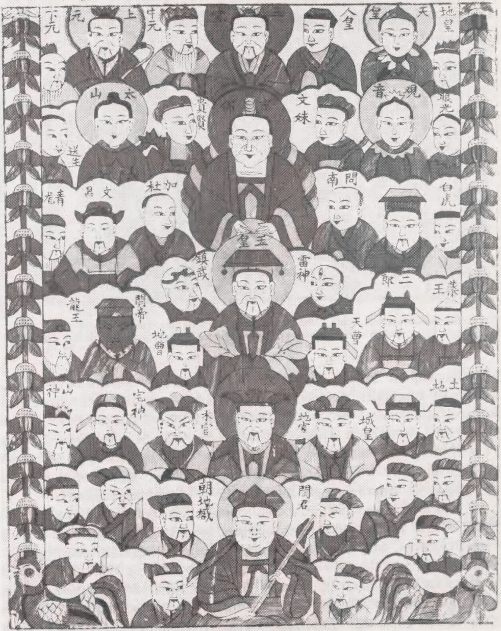
Fig 6 : Pantheon (41x32,6 cm). Bloktryk i farver. Fra Shandong Weixian Yangjiabu muban nianhua. 1983. OA 102-1985-375.

histernes forestillingsverden i sfærer. Daoisterne mener, at verden er delt i en potentiel verden (den tidlige himmel) og en skabt verden (den sene himmel), mens buddhisterne adskiller verden i tre lag, der dækker over jorden (livsbegær), atmosfære (form) og himmel (formløs og ren ånd). Det øverste plan på