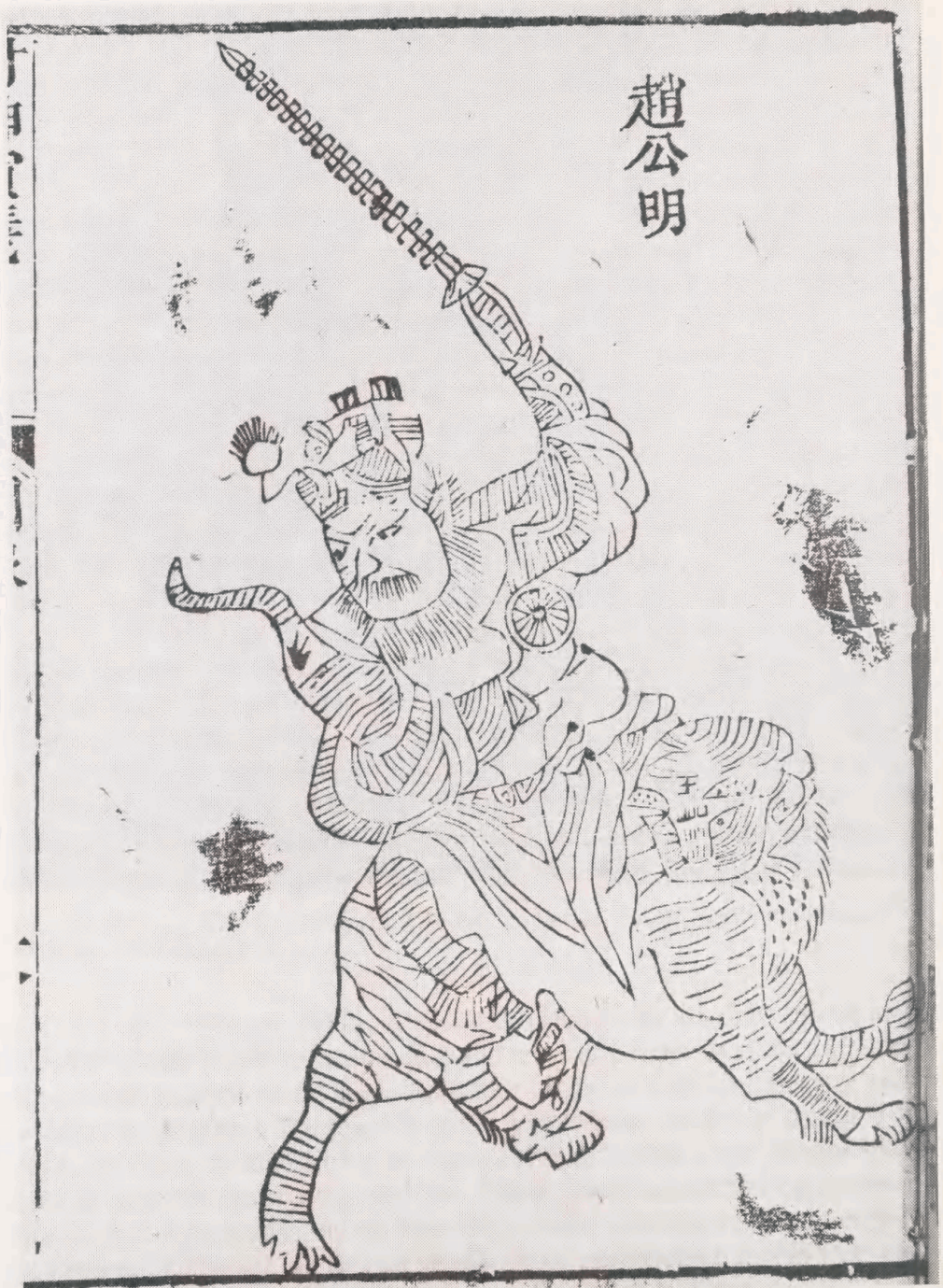
Fig.1 : Zhao Gongmin (19,8x13,5 cm). Rigdomsgud fra den daoistiske gudeverden. Han er også virksom mod sygdom og katastrofer. Bloktryk. Fra Fengshen yanyi i en udgave fra 1880. OA 102-942.