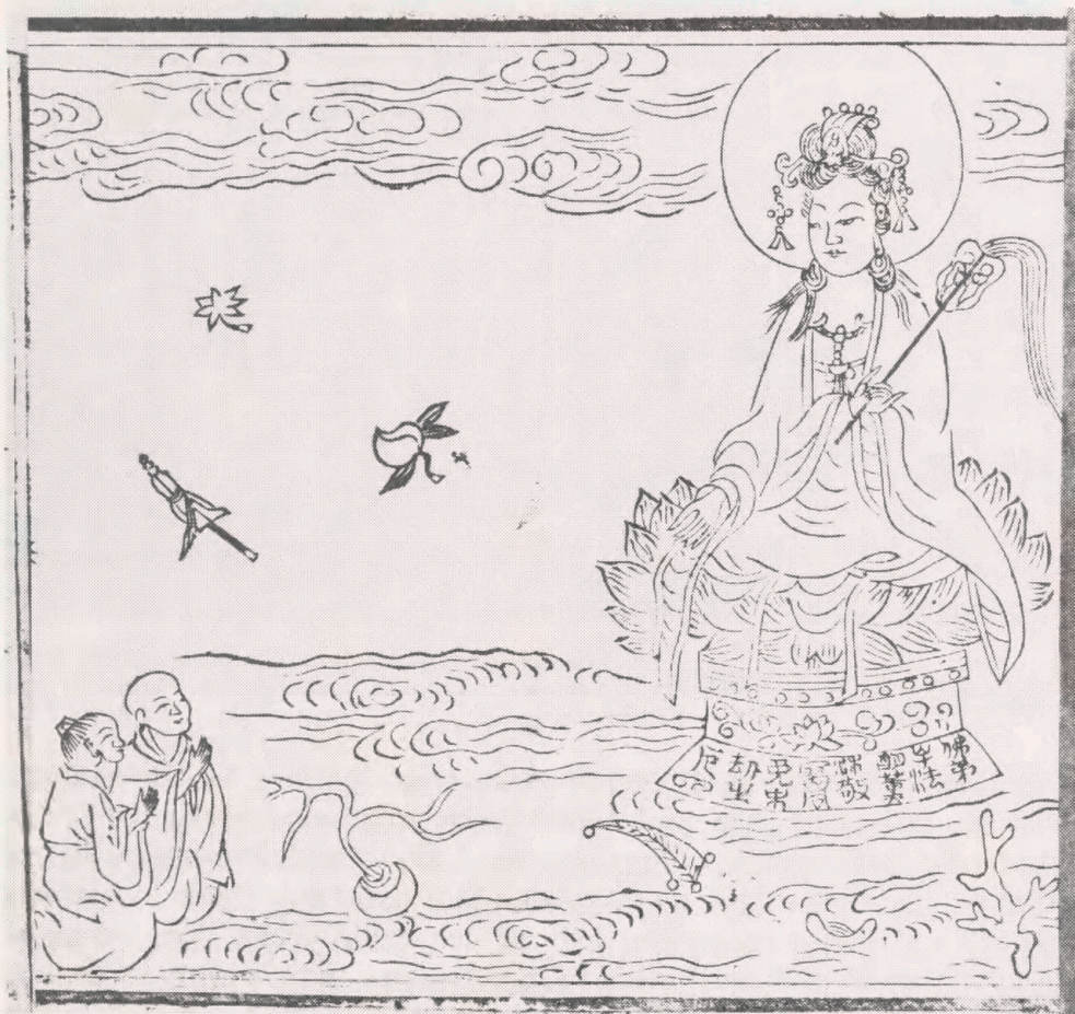
Fig 3 : Guanyin (14,4x15,2 cm). Barmhjertighedsgudinden med en munk og en lægmand som tilbedere. Gudinden og de to tilbedere er omgivet af buddhistiske symboler. Bloktryk. Fra Guanyin pumen pin. 18. årh. OA 102-1976-901.

gang for de enkelte familier alt efter deres dyder eller mangel på samme. Nytårstrykkene med de afbildede guder og assistenter blev benyttet og anvendes igen i en vis udstrækning i dagens Kina som et medie til forbindelse med guderne. Før nytår opstilles nytårstrykkene på altre og gennem nytårsfestlighederne tager guderne bolig i dem. Ved afslutningen af nytårsceremonierne, enten lige efter midnat nytår eller 3-4 dage efter nytårsdag, afbrændes trykkene, hvorved guderne bliver forløst fra deres tilstedeværelse i trykkene og kunne stige op til deres bolig i himlen. Disse tryk har ofte en egen charme i udformningen af motiverne. Den opstår ved en sammenfletning af lyse og mørke felter i enkel, lidt kantet form, som minder en del om et sammensat puslespil. De fleste nytårstryk er flerfarvetryk eller sort på hvid eller gullig grund med mere eller mindre detaljerede håndpåførte farver.