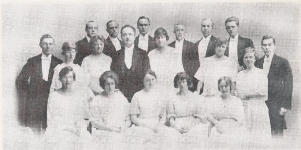
Cæciliaforeningens Madrigalkor 1917.

for det offentlige musikliv. Imidlertid fik kun professionelle orkestre adgang til at låne, og lånetiden var meget kort. I Biblioteksårbogen 1946 skriver Svann Lunn således: "Om man kan komme så langt, at ogsaa Amatørorkestre vil kunne være laaneberettigede, er ikke alene et Pengespørgsmaal, men afhænger ogsaa af, om de ønskede Musikværker overhovedet kan skaffes". Senere står der vedrørende lånetiden: "Hvor intet andet er aftalt, sættes Laanetiden for Instrumentalmusik til en Maaned og for Værker med Kor til to Maaneder".