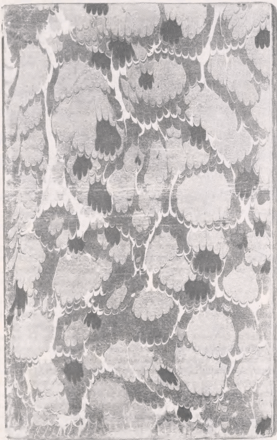
Rød grund, grå, grønne og gule pletter. Kammarmor. Cod.Pers. LXVI. 37,5 x 23 cm.