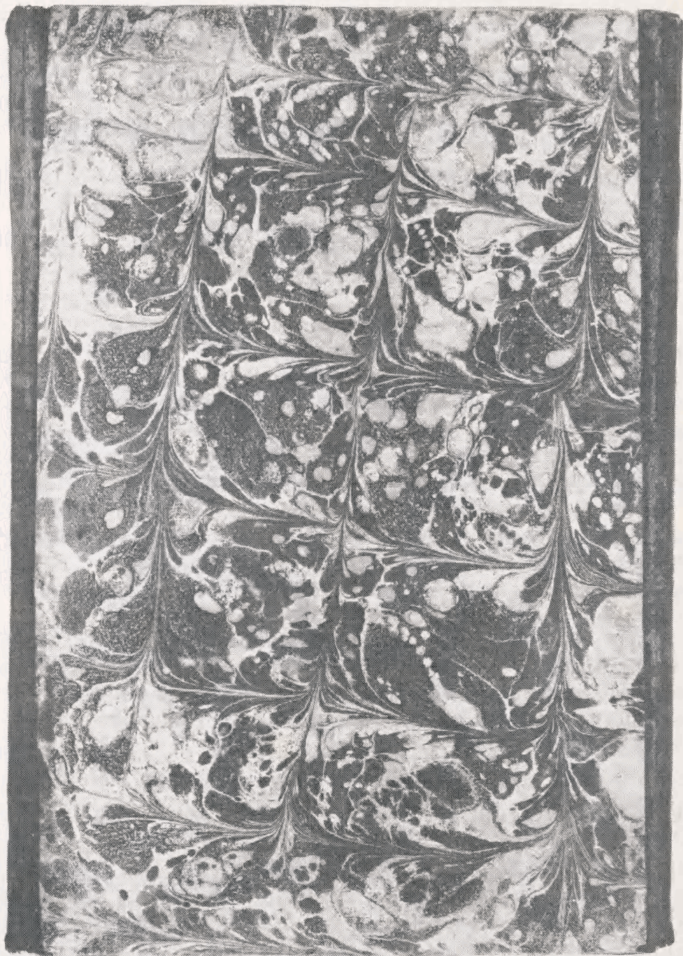
Blåsort, gul og rød. Cod.Arab. XC. 28,5 x 18,5 cm.

1984, De kongelige Biblioteker. Det kongelige Bibliotek 1984.