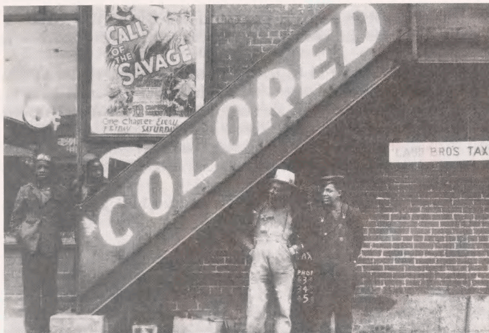
"En negergalleri-indgang i Anniston, Alabama". Fotografi af Peter Sekaer, ca. 1935.