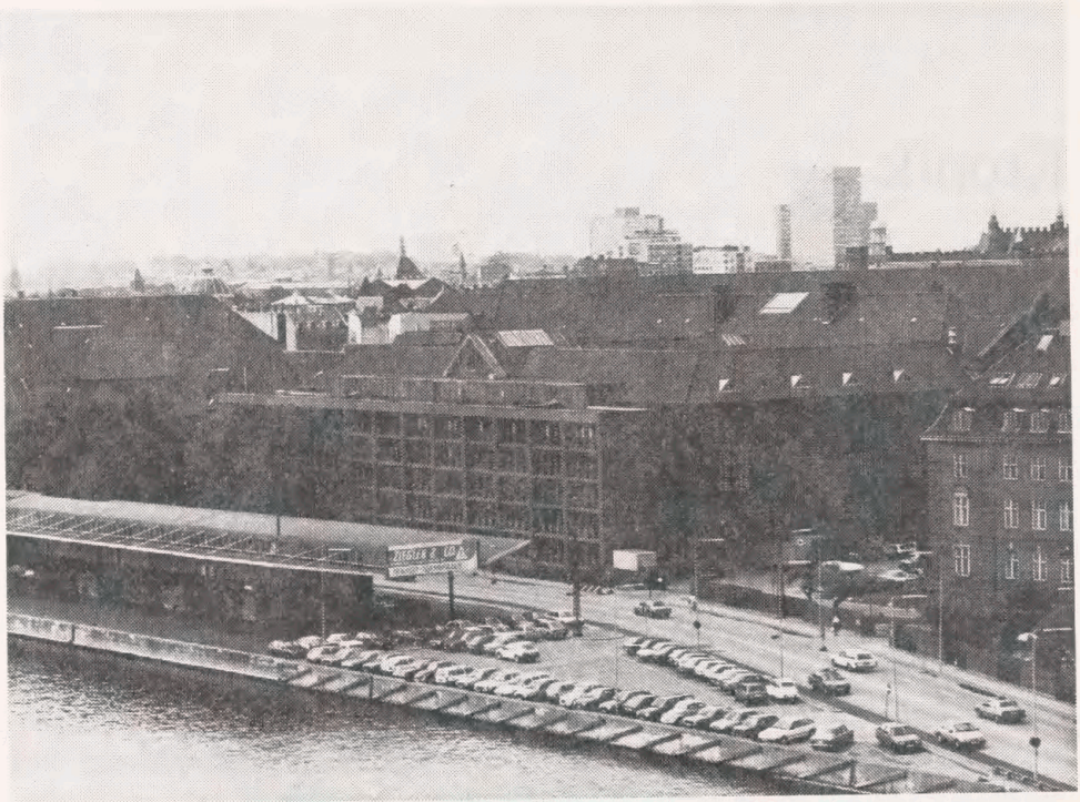
Havnefronten ud for Det kongelige Bibliotek i dag; ud mod Christians Brygge ligger tilbygningen fra 1968. Mellem denne og kajkanten er der mulighed for yderligere udvidelse af biblioteket.

samlinger af kort, billeder, håndskrifter - også orientalske og judaistiske -, noder, bøger og andre materialer.