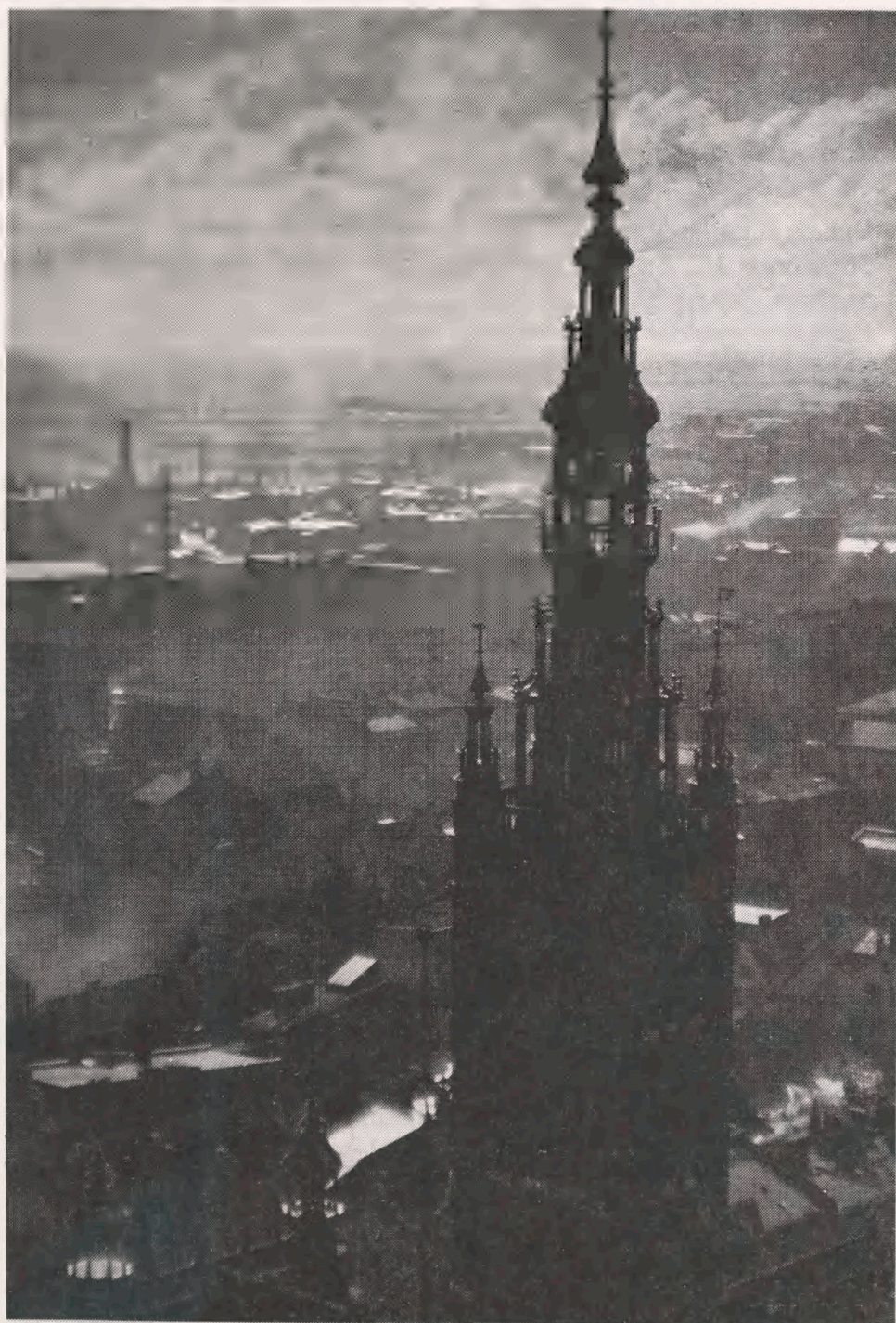
1950). - Erhvervet til Kort- og Billedafdelingen.