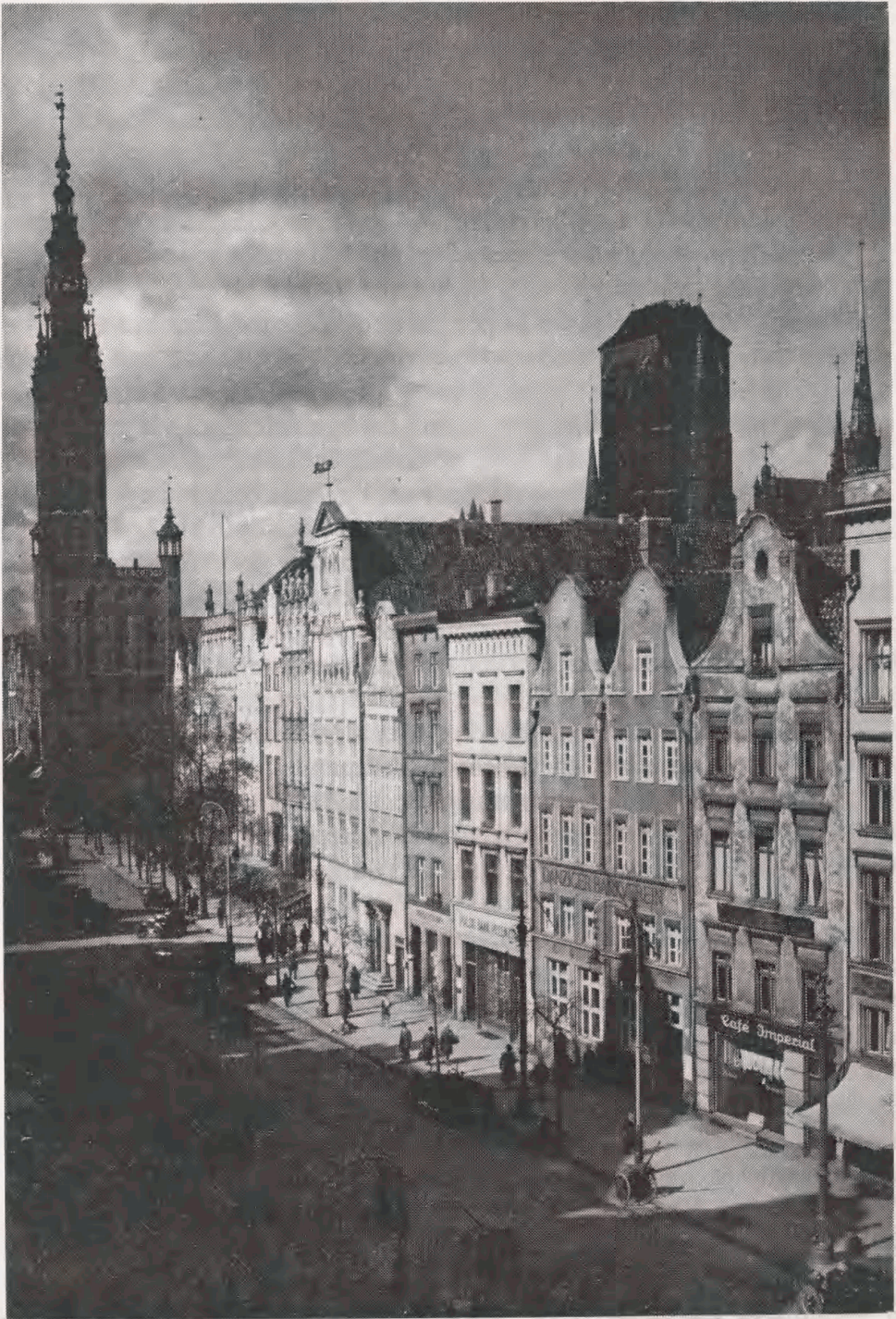
Disse to fotografier er fra et album "Danzig", 1927, af den polske fotograf Jan Bulhak (1876-