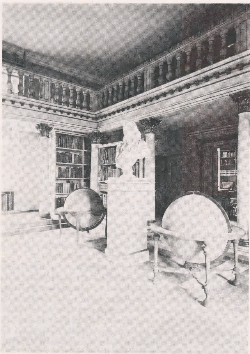
Frederik 3.s bibliotekssal. De 3 synbare søjler for enden af salen (overbibliotekarens kontor skimtes til højre) har oprindeligt været rødbrunt marmorerede med sorte og hvide indslag, det samme gælder mæglerspejlene ovenover (hjørnemægleren over hjørnesøjlen ses tydeligt). Søjlen til venstre, den første på langsiden, har været grøngrå marmorerede med sorte og okker indslag som mæglerspejlet ovenover. De buttede ballustre på galleriet var sortmarmorerede med hvide indslag. (Ballustrene i den lille sal er slankere, se ovenfor s. 44). Galleriets håndfang, mæglerrammer og gesims var ensfarvet hvidgrå, mens konsoller, lister, søjlekapitæler og søjlebaser var forgyldte. Busten af Frederik 3. står i dag i bunden af Læsesalen, globerne i Kort- og Billedafdelingen.