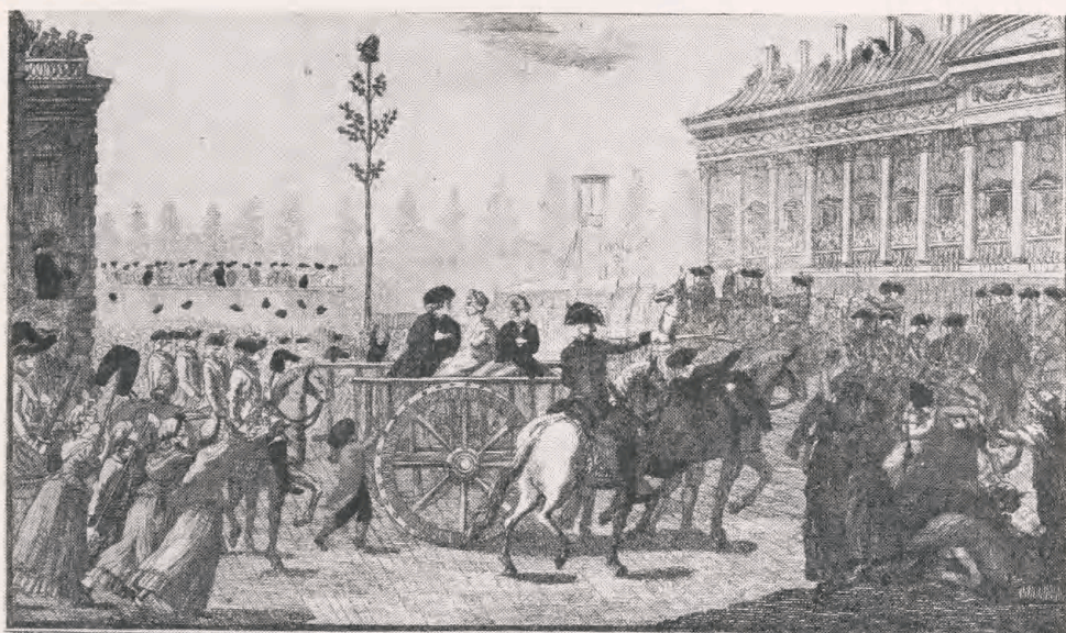
Vorstellungsmärkte Königin von Frankreich, Marie Antoinette wurde Conciergerien nach der Guillotine den 16. Okt. 1793 gebracht wurde

Her ses, hvorledes dronningen af Frankrig, Marie Antoinette, blev ført fra Conciergeriet til guillotine den 16. oktober 1793.