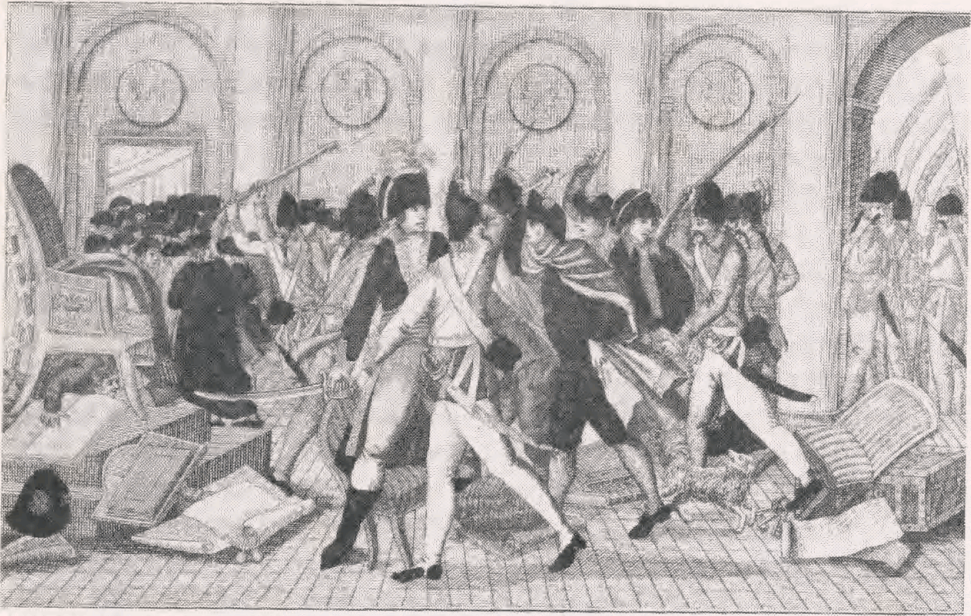
Generalissimus [Napoleon] Bonaparte ophæver det ufredelige Konvent [de fem hundredes råd] og er i fare for at blive myrdet, hvilket bliver afværget af to grenaderer [den 9. november 1799].

tionen har villet have os til at tro. Man må håbe, at udstillingen vil inspirere til ny forskning inden for dette vigtige emne.