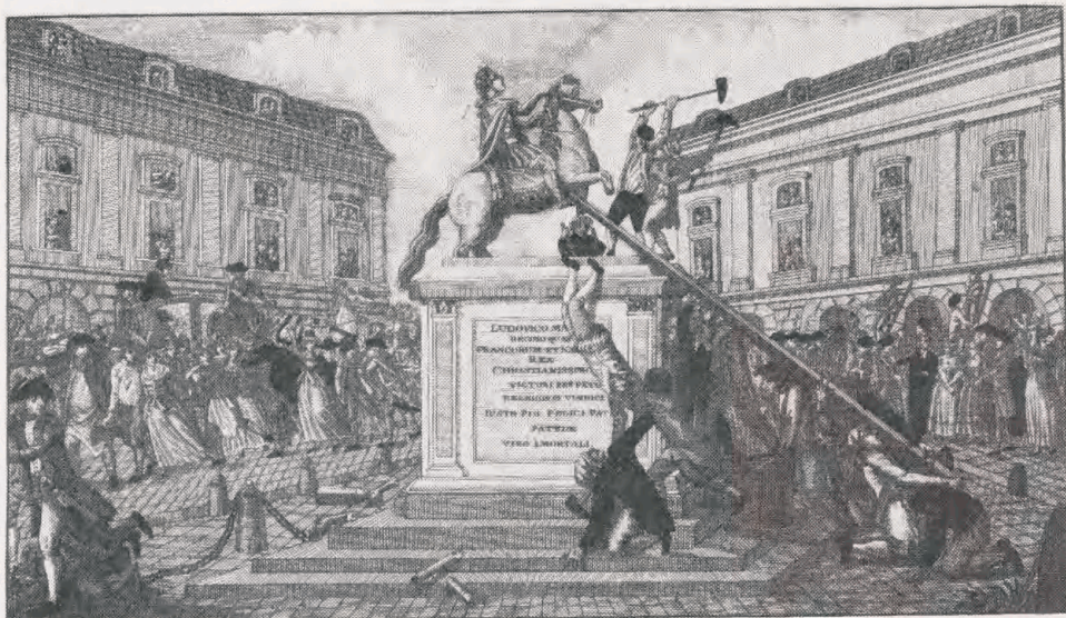
Her vises, hvorledes Ludvig XIVs statue Place Vendôme, førhen Ludvig den Stores Plads, i Paris blev ødelagt på Nationalkonventets befaling i januar 1793.