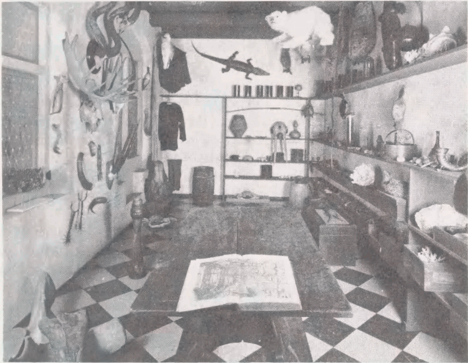
Rekonstruktionen af Museum Wormianum 1988.