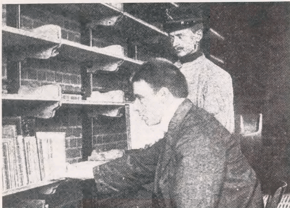
Fra flytningen i 1906: Bøgerne opstilles i det nye bibliotek, under bibliotekarisk kontrol.