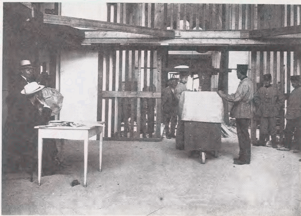
Fra flytningen i 1906: Transporten kontrolleres. Siddende, med stråhat, A.A. Bjørnbo.

videlse af pligtafleveringens omfang i forhold til tidligere. Ganske vist blev eksemplartallet på 2 af de afleverede tryksager til Det kongelige Bibliotek ikke forøget, men definitionen af afleveringspligtige tryksager blev betydeligt udvidet, således at praktisk taget alt, hvad der blev trykt i landet, nu blev omfattet af loven. Følgen var, at den gruppe, der benævntes småtryk, med ét blev overordentlig omfangsrig. Samtidigt øgedes også den totale mængde af bogtrykkernes øvrige produktion støt fra år til år, således at magasinerne blev fyldt hurtigere op end forudset. Herudover var særstillingerne, navnlig Dansk Folkemindesamling - senere udskilt fra Det kongelige Bibliotek som en selvstændig institution - vokset hurtigere end beregnet, og desuden var bibliotekets øvrige accession af bøger, både i form af køb og gaver, langt større end forudset. - Kort sagt, renters rente effekten var uforudset.