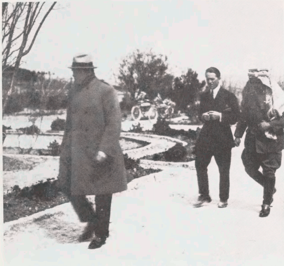
Winston Churchill sammen med den legendariske "Lawrence of Arabia" (i midten) og emiren i Transjordanien 'Abdullah ibn Husein. ( The Quarterly Journal of the Library of Congress 30/1973, s. 42). Billedet findes ikke i Matson's albums, hvor der til gengæld er andre med Lawrence og Abdullah (jvf. The Middle East in Pictures III , s. 501ff.) - Negativet er blandt dem, der kom til Library of Congress efter Seksdages Krigen i 1967.

De originale albums findes i Library of Congress' Documentary Photography Prints and Photographs Division. (Her kan aftryk af negativene også bestilles.) Det er ikke første gang, lederen af denne Division, som også er udgiver af fotokavalkaden, George S. Hobart, har informeret den brede offentlighed om fotos fra den Amerikanske Koloni i Library of Congress. I 1973 offentliggjorde han således i The Quarterly Journal of The Library of Congress (side 19-43) artiklen The Matson Collection. A Half Century of Photography in the Middle East , som siden uændret blev optrykt side 109-128 i A Century of Photographs 1846-1946. Selected from the Collections of the Library of Congress. Compiled by Renata V. Shaw. Washington 1980 . (Her nævnes Matsons 11 albums, som altså blev udgivet samme år, end ikke i en note!). I sin Introduction til det store fotoværk (side 1-15) har Hobart iøvrigt atter genbrugt største parten af artiklen fra 1973. Illustrationerne er