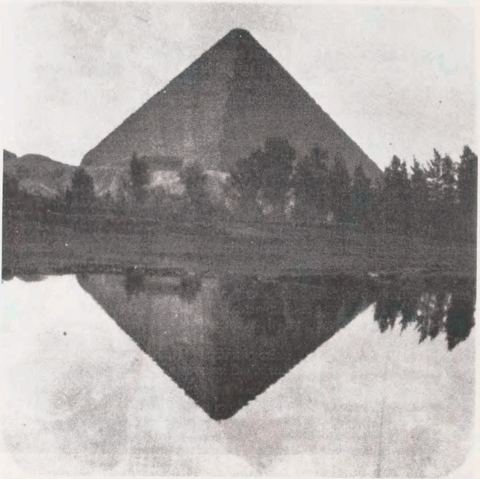
Keops-pyramiden syd for Kairo. Fra: Matson's album VI, nr. 1503 (The Middle East in Pictures II, s. 427).

skueligt er ordnet i grupper efter regioner eller særlige emner. "Katalogen" indekserer - som det anføres - varesortimentet i forretningen "The Matson Photo Service. G. Eric Matson, Jerusalem" og omfatter "Photographs & Lantern Slides. Bible Lands etc. Palestine, Syria, Egypt, Iraq, and East Africa". Nævnes kan bl.a. enestående fotoserier om klippebyen Petra, om græshoppeplagen i Palæstina i marts-juni 1915, om agerbrug og håndværk, om de tidligste zionistiske aktiviteter og første jødiske kolonier og bosættelser i Palæstina, om den ny æra med det britiske mandatstyre efter Første Verdenskrig, dertil flotte luftfotos og meget mere. Udgiveren, George S. Hobart fra Library of Congress, har med heldig hånd i det fjerde og sidste bind (side 927-962) forsynet det hele med et fortrinligt og meget detaljeret indeks, som helt sikkert vil gøre fyldest i enhver søgning efter fotografiske motiver.