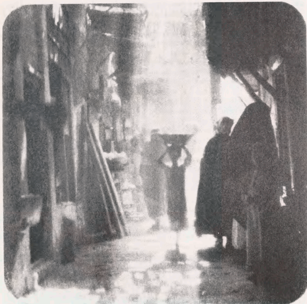
Snæver bazargade i Najaf i Irak. (I Najaf (Najef) findes Muhammeds fætter og svigersøn 'Alis grav, et berømt helligsted, hvortil shi'itter fra Irak og Iran valfarter.)

Det giver ialt 20.000 negativer, hvoraf de udgivne albummer altså kun udgør en fjerdedel.