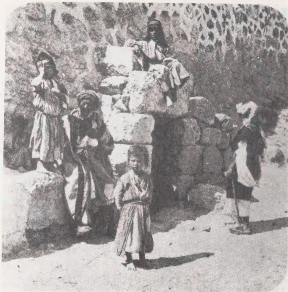
"Lazarus' grav" i Betania. (Om Jesu opvækkelse af Lazarus, Martas og Marias broder, fortælles i Johannes Evangelium kap. 11.)

tionerne i indledningen er imidlertid andre end dem i artiklen fra 1973 (og optrykket fra 1980); de stammer fra ca. 7.000 negativer, som først efter Seksdages Krigen i 1967 - altså tyve år efter at Matson havde forladt Jerusalem - var blevet reddet ud af Østjerusalem.