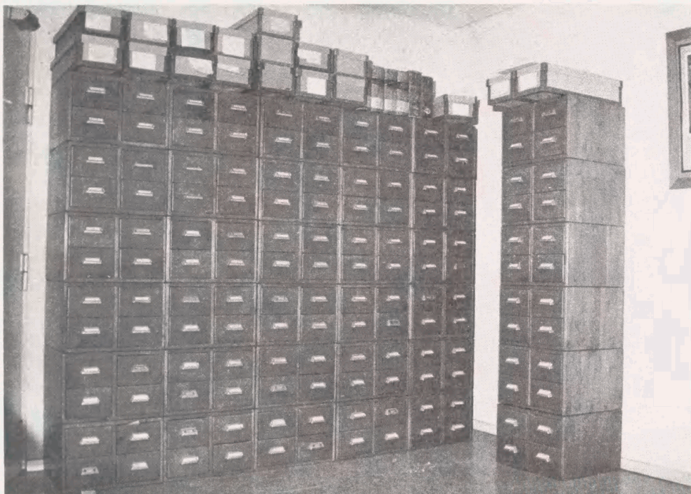
Ensomt og forladt - kartoteket i dag -

Det er klart, at det er et stort minus, at omarbejdelsen ikke er blevet gjort færdig, men det der er gjort, er et godt og højt kvalificeret arbejde, hvori der er investeret ganske mange årsværk. Jeg synes, man alvorligt bør overveje at bringe det i anvendelse i forbindelse med den påtænkte retrokatalogisering af de ældre kataloger.