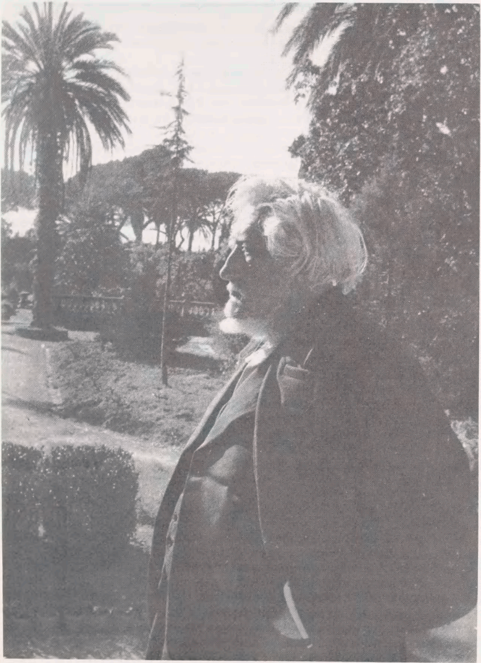
Maleren og billedhuggeren J.F. Willumsen (1863-1958). J.F. Willumsen var i en lang periode af sit liv bosat i Sydfrankrig.