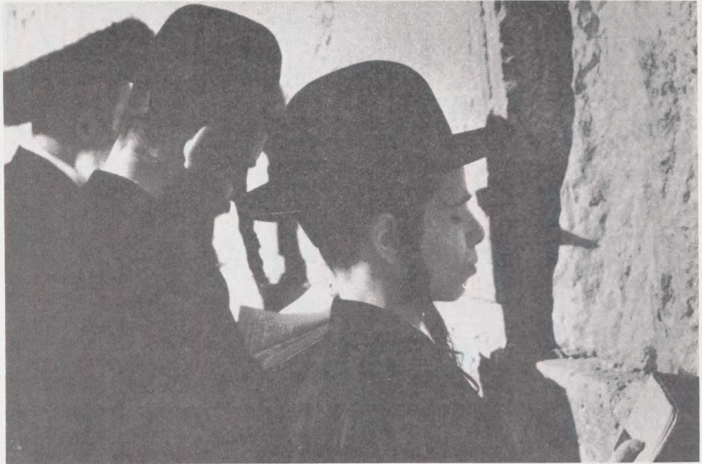
Jerusalem. Fotograf: Flemming Bo Andersen. 1987. - Erhvervet til Kort- og Billedafdelingen.