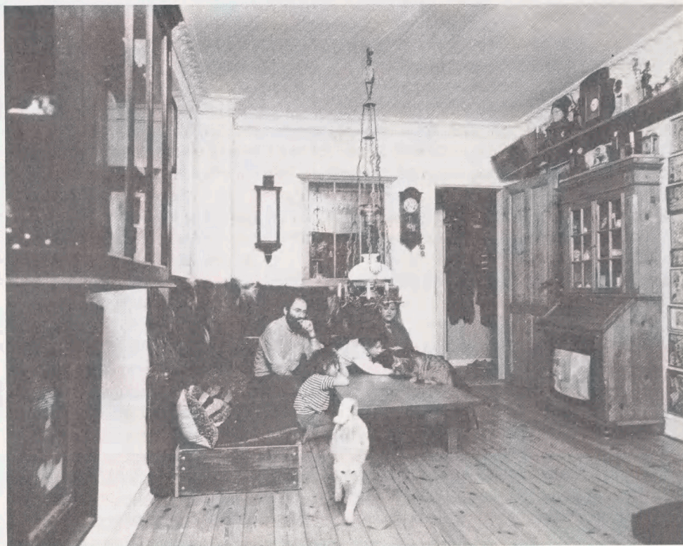
Fra serien "Living Room" 1979ff. Fotograf: Stefan Wurzel. - Erhvervet til Kort- og Billedafdelingen.