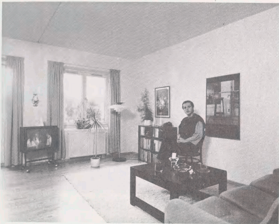
Fra serien "Living Room" 1979ff. - Erhvervet til Kort- og Billedafdelingen.

Portrætter af Industriens Realkreditfonds repræsentanter fra forskellige kredse, samt af medlemmer af kontrolkomitéen og af direktionen. Fra Industriens Realkreditfond.