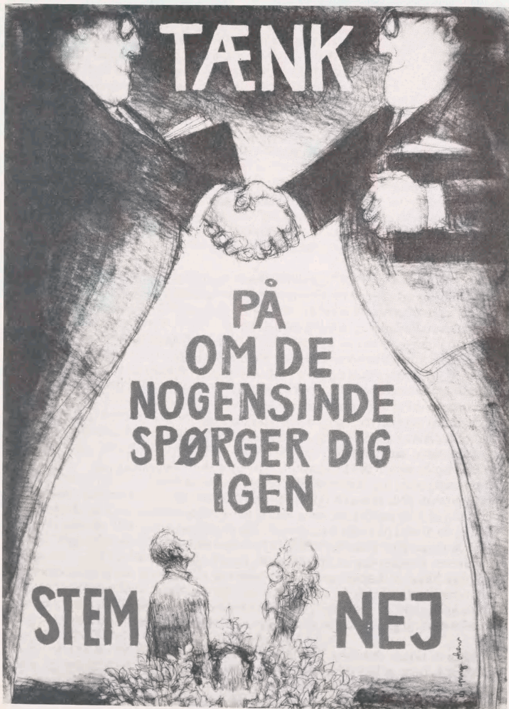
Folkebevægelsen mod EF. Plakat af Ib Spang Olsen. - Erhvervet til Kort- og Billedafdelingen.