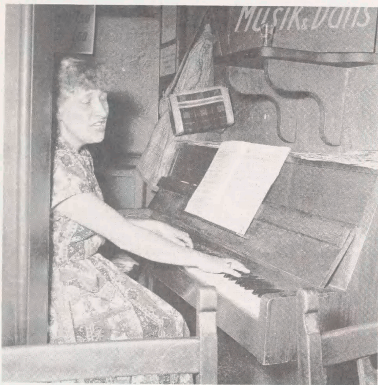
Erhvervet til Kort- og Billedafdelingen.