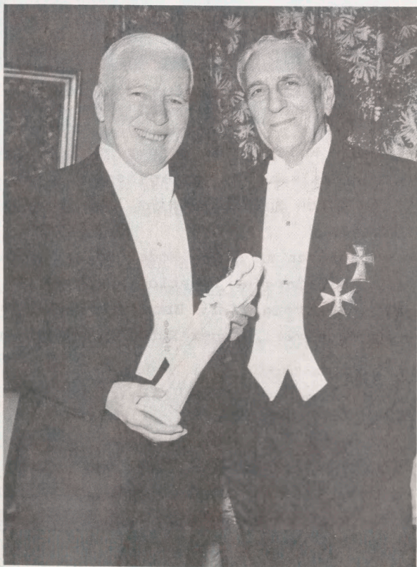
Poul Reumert og Charles Chaplin, dec. 1959; optaget i Paris ved Beatrice Bret- ty's afskedsforestilling på Comédie Française.