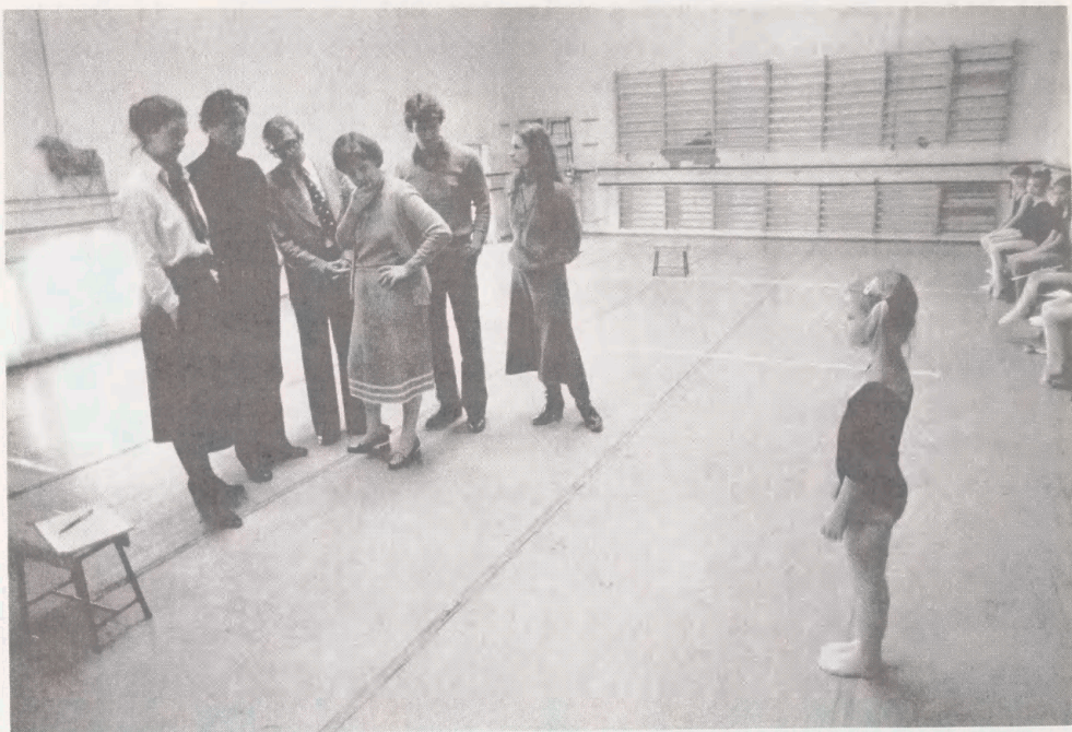
Fra bogen "Ballettens børn" Kbh. 1986. Fotograf: Marianne Grøndahl. - Erhvervet til Kort- og Billedafdelingen.

Jette Drewsens manuskript til romanen Udsøgt behandling (1986).