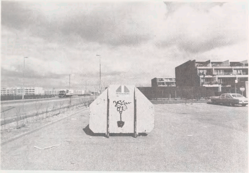
Høje Tåstrup, 29/4 1985. Fotograf: Fuldmægtig Arne Andreassen. - Erhvervet til Kort- og Billedafdelingen.