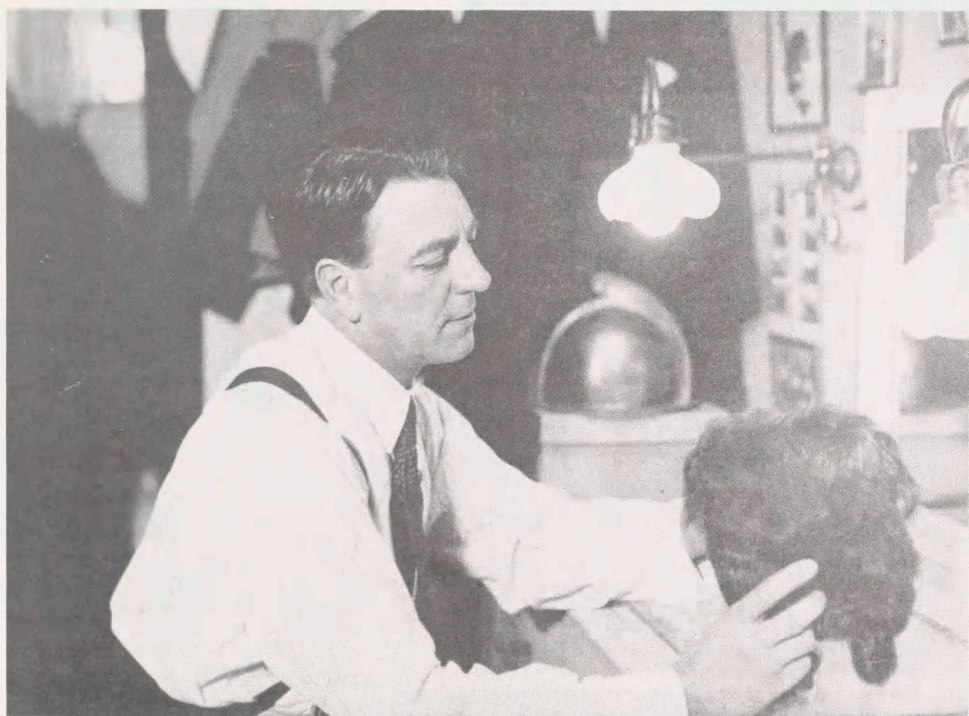
1927. Poul Reumert i færd med at klæde sig ud som Cyrano i "Cyrano de Bergerac"; Det kgl. Teater.