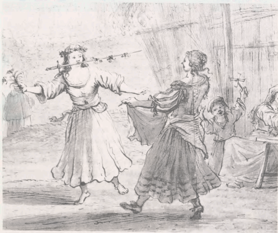
En kvinde danser tarantel. - Illustration fra ovennævnte værk.