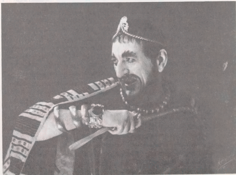
1937/38. "En Idealist", Det kgl. Teater.