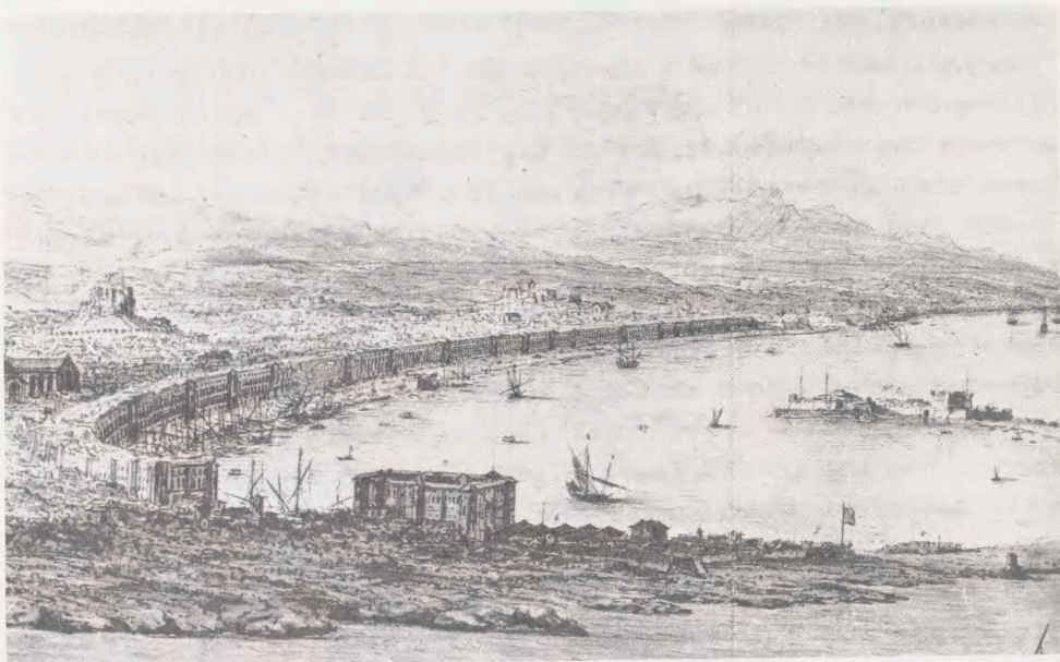
Messina, set fra syd-øst. Fra W. Schellinks fecit. - Se omtalen på foregående side.