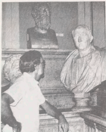
Artiklens forfatter betragter en buste af Cicero på Senatsmuseet i Rom.

på. De fik ham sendt i landflygtighed i år 58 f.v.t. af den grund.